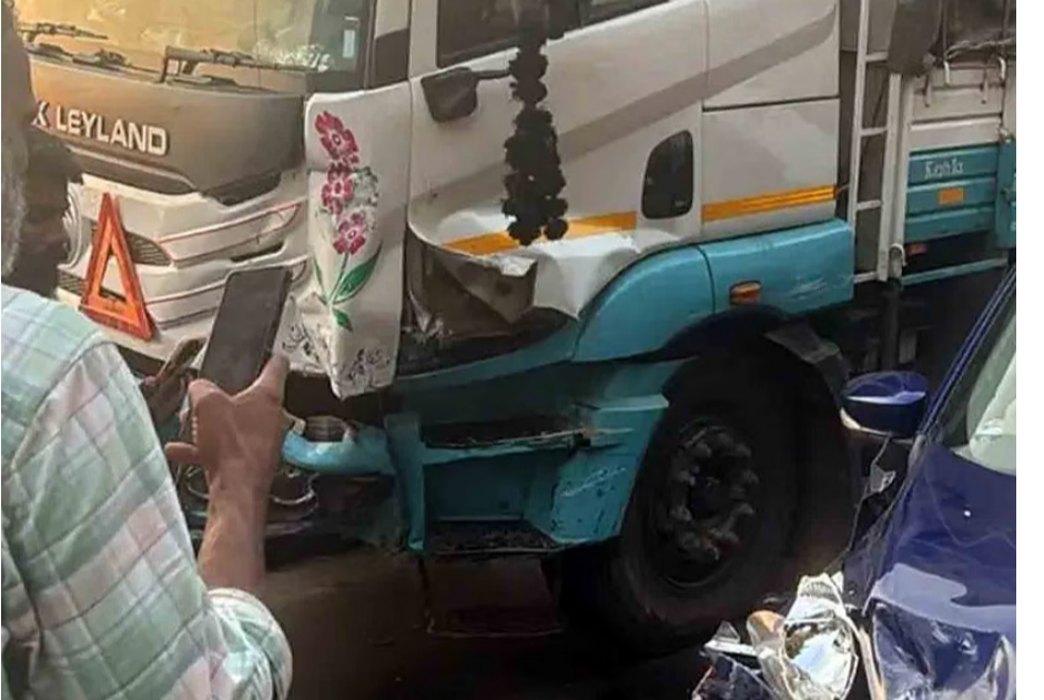
പോലീസ് സഭാസീയായ ചരക്ക് ലോറി ഡൈവർ മദ്യപിച്ചതായി ആരോപണമുണ്ട്. ഇയാളെ ഡൈവർ കുറ്റിപ്പുറം പൊലീസ് കസ്റ്റഡിയിലെടുത്തു.

മലപ്പുറം: ദേശീയപാതയിൽ കുറ്റിപ്പുറത്ത് റെയിൽവേ മേൽപ്പാലത്തിന് സമീപം വാഹനങ്ങളുടെ കൂട്ടയിടി. നിയന്ത്രണവിട്ട ചരക്ക് ലോറിയാണ് അപകടത്തിന് ഇടയാക്കിയത്. കോഴിക്കോട് ഭാഗത്തുനിന്നും ചരക്കുമായി എറണാകുളത്തേക്ക് പോവുകയായിരുന്ന ലോറി നിയന്ത്രണം നഷ്ടപ്പെട്ട് മറ്റ് വാഹനങ്ങളിൽ ഇടിക്കുകയായിരുന്നു. തൊറാഴ്ച വൈകിട്ട് 6.30നാണ് സംഭവം. ചരക്ക് ലോറിയെ കൂടാതെ ആറു കാറുകളും ഒരു ടൂറിസ്റ്റ് ബസുമാണ് അപകടത്തിൽപ്പെട്ടത്. കാറുകളിൽ ഇടിച്ച് ലോറി ഡിവൈഡറിൽ ഇടിച്ച് നിൽക്കുകയായിരുന്നു.