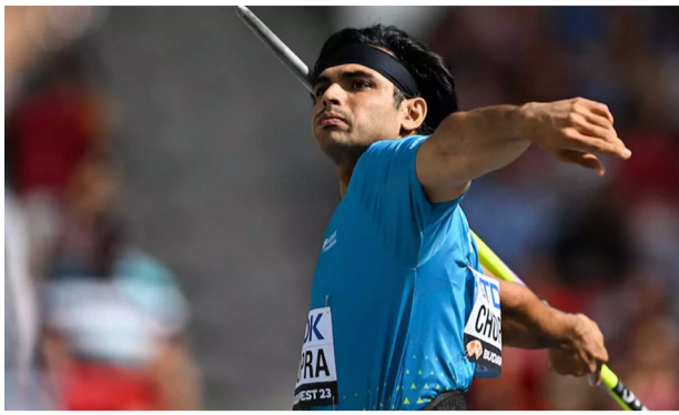
വെച്ച് 88.38 മീറ്റർ ദൂരമെറിഞ്ഞ് ഒന്നാമതെത്തി. ഗ്രന്ഥാധ്യയുടെ

വന്തർ: ദോഹ ഡയമണ്ട് ലീഗിൽ ഇന്ത്യയുടെ നീരജ് ചോപ്രക്ക് വെള്ളി. അഞ്ചാമത്തെയും അവസാനത്തെയും ത്രോയിൽ 88.36 മീറ്റർ ദൂരം കണ്ടെത്തിയാണ് നീരജ് വെള്ളി മെഡൽ അണിഞ്ഞത്. വെറും 0.02 മീറ്ററിനാണ് ഇന്ത്യൻ സൂപ്പർ താരത്തിന് ഒന്നാംസ്ഥാനം നഷ്ടമായത്. സീസണിലെ മികച്ച ദൂരം കണ്ടെത്തിയ ചോപ്ര തന്റെ സ്ഥാനം ദുരമായ 90 മീറ്ററിനേക്കാൾ ജാവലിൻ എത്തിക്കാൻ ശ്രമിച്ചെങ്കിലും കഴിഞ്ഞില്ല. നിലവിലെ ചാമ്പ്യൻ ചെക്ക് റിപ്പബ്ലിക്കിന്റെ യാക്കോബ് വാഡ്