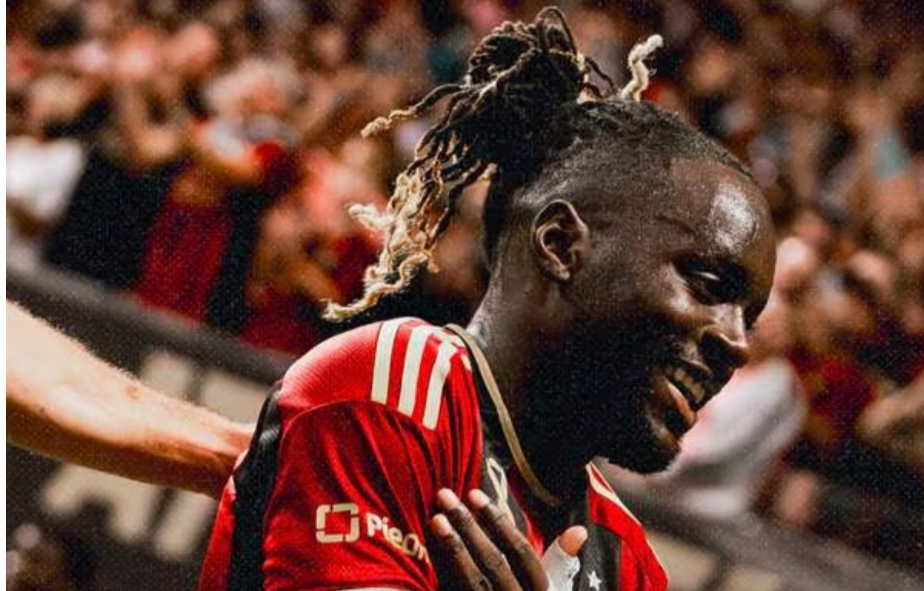
അറ്റലാന്റയുടെ ആദ്യ ഗോൾ വലയിലാക്കിയ മുയുമ്പ

വികറ്റ്കൾ എട്ട് റൺസിന് വീണു. അഞ്ച്, ആറ് വികറ്റ്കൾ 12 റൺസിനെയും കടപനായി ക്രീസിൽ അവശേഷിച്ചു. 33ൽ ഏഴാം വികറ്റും 40ൽ എട്ടാം വികറ്റും 50റൺസിന് ഒൻപത്, പന്ത് വികറ്റുകളും വീണു.