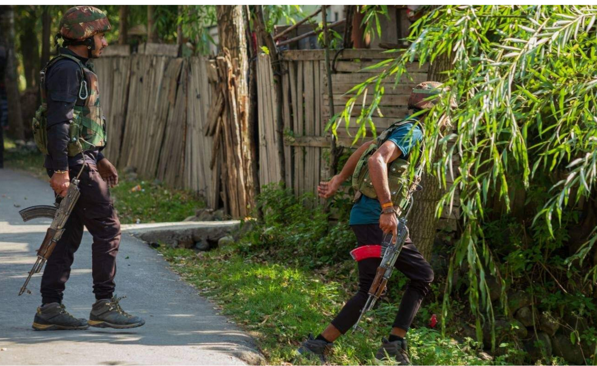
സൈന്യം തിരച്ചിൽ നടത്തുന്നു

ശ്രീനഗർ: ഭീകരമായുള്ള ഏറ്റുമുട്ടൽ ആറാം ദിവസവും തുടരുന്നതിനിടെ ജമ്മുകശ്മീരിലെ അനന്തനാഗിൽ നിന്ന് കത്തിക്കരിഞ്ഞ നിലയിൽ ഭീകരന്റെ മൃതദേഹം കണ്ടെത്തി. വസ്ത്രധാരണ രീതിയുടെ അടിസ്ഥാനത്തിലാണ് തീവ്രവാദിയാണെന്ന സൂരക്ഷാ സൈന്യത്തിന്റെ നിഗമനം. തിങ്കളാഴ്ച രാവിലെ മുതൽ സൈന്യം ഭീകരർക്കായുള്ള തിരച്ചിൽ പുന്നരാംംഭിച്ചതോടെയാണ് ഭീകരന്റെ മൃതദേഹം കണ്ടെത്തിയത്. അതേസമയം, ഗാരോൾ വനത്തിനുള്ളിൽ ഒളിച്ചിരിക്കുന്ന മറ്റ് ഭീകരർക്കായുള്ള തിരച്ചിൽ തുടരുകയാണ്. ഞായറാഴ്ച സൈന്യവും ഭീകരരും തമ്മിൽ രൂക്ഷമായ ഏറ്റുമുട്ടൽ നടന്നിരുന്നു. കനത്ത ആയുധധാരികളായ നാല് ഭീകരരാണ് കാട്ടിൽ ഒളിച്ചിരിക്കുന്നതെന്ന് വിവരം. ഭീകരരെ തുരത്താനുള്ള ശ്രമത്തിനിടെ, രണ്ടു സേനാ ഉദ്യോഗസ്ഥരും ഒരു ജമ്മുകശ്മീർ പൊലീസ് ഉദ്യോഗസ്ഥനും വീരമൃത്യു വരിച്ചിരുന്നു. സൈന്യം നൂറുകണക്കിന് മോർട്ടാർ ഷെല്ലുകളും റോക്കറ്റുകളും തൊടുത്തു വിട്ടിരുന്നു. ഭീകരരുടെ ഒളിത്താവളങ്ങൾ ലക്ഷ്യമിട്ട്