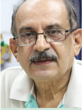
എസ്. എ വുദ്സി വൈസ് പ്രസിഡണ്ട്