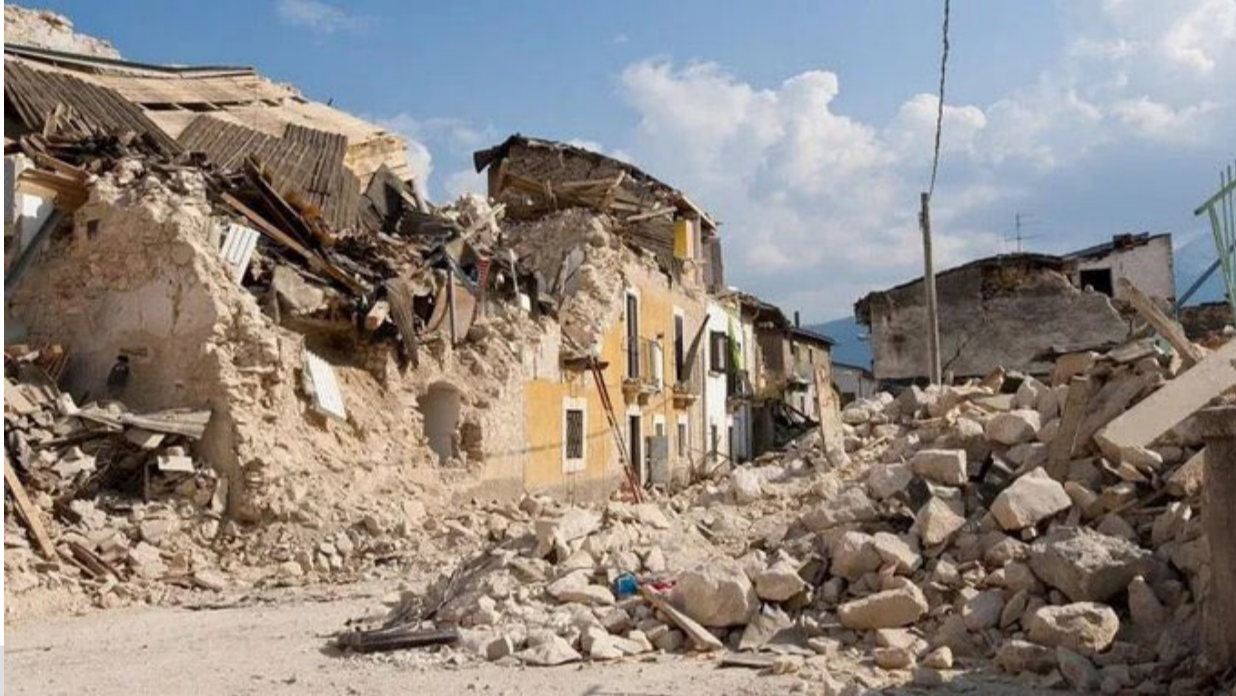
ഭൂകമ്പത്തിൽ തകർന്ന കെട്ടിടങ്ങൾ

തുടർന്ന് മൊറോക്കയിൽ റസ്റ്ററന്റുകളിൽ നിന്നും പണയങ്ങളിൽ നിന്നും ആളുകളെ ഒഴിപ്പിക്കുന്ന ദൃശ്യങ്ങൾ ഉൾപ്പെടെ പുറത്ത് വന്നിട്ടുണ്ട്. ചരിത്ര നഗരമായ മറാക്കഷിലെ ചരിത്ര ഭാഗങ്ങൾക്ക് കേടുപാട് പറ്റിയെന്നും റിപ്പോർട്ടുണ്ട്.