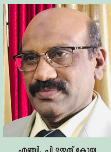
എ.ബി. പി മമ്മൽ കോയ സിയസ്കൊ പ്രസിഡണ്ട്