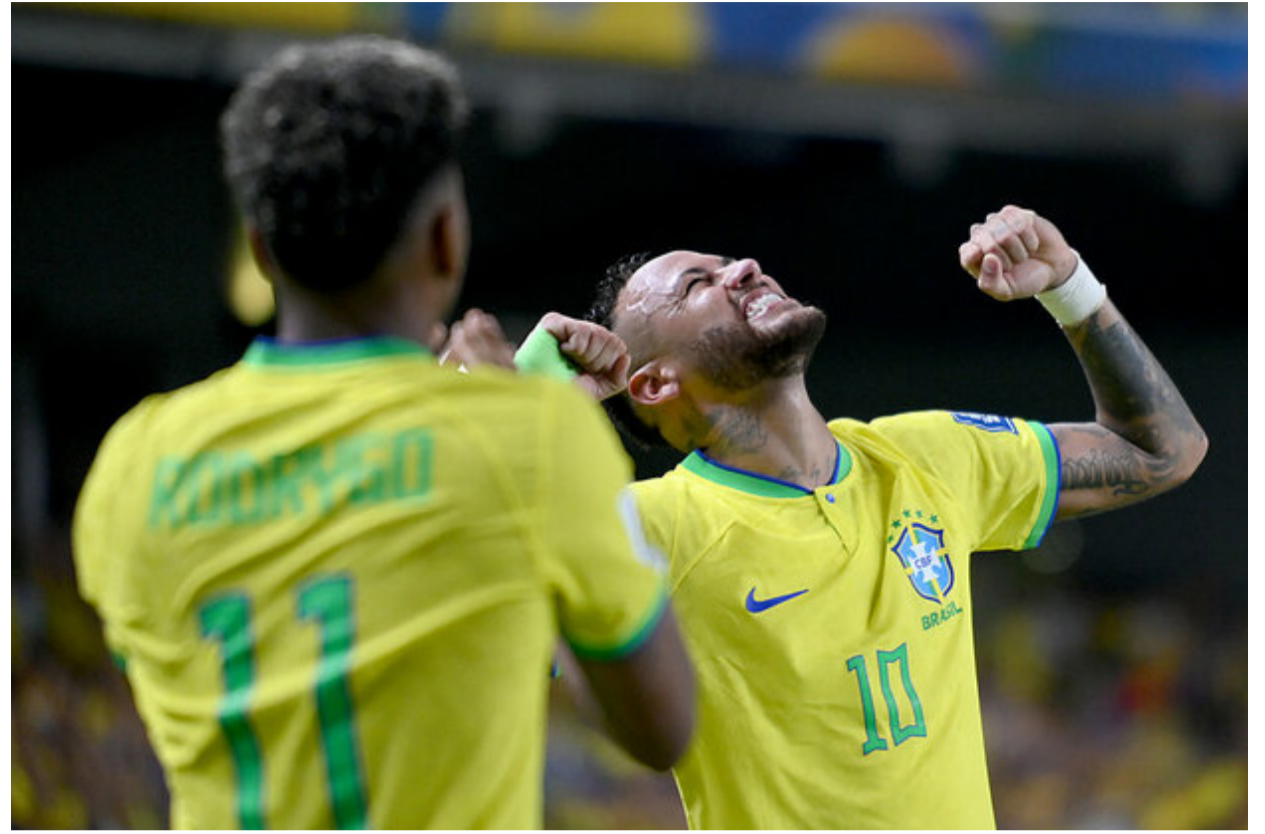
ഗോൾ നേടിയ നെയ്മറിന്റെ ആഹ്ലാദം, സമീപം റോഡ്രിഗോ

ബ്രസീലിനായി 91 മത്സരങ്ങളിൽ നിന്നാണ് 77 ഗോളുകൾ പെലെ നേടിയത്. എന്നാൽ 124-ാം മത്സരത്തിലാണ് നെയ്മറിന്റെ നേട്ടം. അതിനാൽ തന്നെ ഇതിഹാസത്തിന്റെ നേട്ടം നേട്ടമായി തന്നെ തുടരും. 98 കളിയിൽ 62 ഗോൾ നേടിയ റൊണാൾഡോയാണ് ബ്രസീലിയൻ ഗോൾവേട്ടക്കാരിലെ മൂന്നാമൻ. 55 ഗോളുള്ള റൊമാരിയോ നാലാം സ്ഥാനത്തും 48 ഗോളുള്ള സീക്കോ അഞ്ചാം സ്ഥാനത്തുമാണ്. റെക്കോർഡ് തിരുത്തിയ തോടെ പുതിയ റെക്കോർഡ് ഇനി നെയ്മർ കളി നിർത്തുന്ന ദിവസമായിരിക്കും തങ്കലിപികളിൽ ഉറപ്പിച്ചു നിൽക്കുക. അതുവരെ നെയ്മർ എന്ന ബ്രസീലിയൻ സൂപ്പർ താരം ഗോളടി തുടരും.