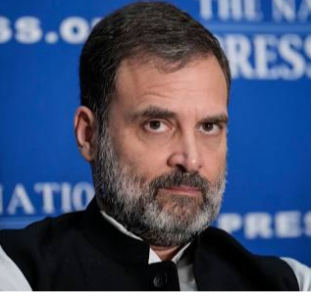
രാജ്യത്തിന്റെ യുണൈറ്റഡ് നേതാവുമാണ് രാഹുൽ ഗാന്ധി. ഇത് എന്റെ വാക്കാണ്.

ന്യൂഡൽഹി: ഇന്ത്യയിൽ നിന്ന് വിദ്വേഷം തുടച്ചുനീക്കുകയും എല്ലാവരും ഒറ്റപ്പെട്ടവർ മാറുകയും ചെയ്യുന്നതുവരെ ഭാരത് ജോഡി യാത്ര തുടരും എന്ന് ഭാരത് ജോഡി വി.പി.യോയും രാഹുൽ പങ്കുവെച്ചു. 'റെക്യൂയറി സ്പേസ്' പേരിൽ വിജ്ഞാപനം ചെയ്ത വി.പി.യോയും രാഹുൽ പങ്കുവെച്ചു. 'റെക്യൂയറി സ്പേസ്' പേരിൽ വിജ്ഞാപനം ചെയ്ത വി.പി.യോയും രാഹുൽ പങ്കുവെച്ചു. ഭാരത് ജോഡി യാത്ര തുടരും എന്ന് വി.പി.യോയും രാഹുൽ പങ്കുവെച്ചു. 'റെക്യൂയറി സ്പേസ്' പേരിൽ വിജ്ഞാപനം ചെയ്ത വി.പി.യോയും രാഹുൽ പങ്കുവെച്ചു. 'റെക്യൂയറി സ്പേസ്' പേരിൽ വിജ്ഞാപനം ചെയ്ത വി.പി.യോയും രാഹുൽ പങ്കുവെച്ചു.