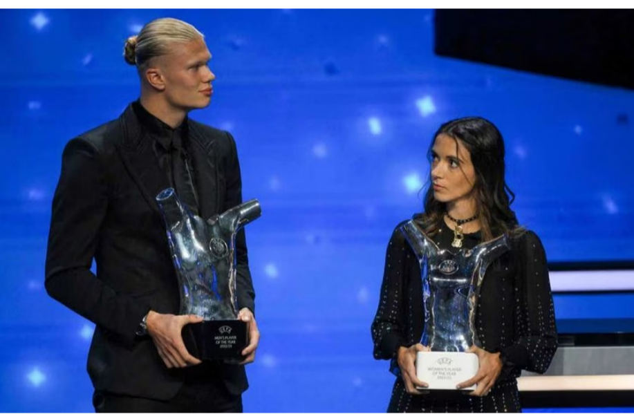
ഴിഞ്ഞ ദിവസം പി.എഫ്.എ. ചെമ്പർ ഓഫ് ദ ഇയർ പുരസ്കാരം ഹാളണ്ടിന് സമ്മാനിക്കുകയായിരുന്നു. സ്പെയിനിന്റെ ഐറ്റാൻ ബെൻമറ്റിയോണ് മികച്ച വനിതാ താരം മാഞ്ചസ്റ്റർ സിറ്റി പരിശീലകൻ പെപ്പ് ഗാർഡിയോളക്കാണ് മികച്ച പരിശീലകനുള്ള പുരസ്കാരം.

യുവേഫയുടെ പോയ വർഷത്തെ ഏറ്റവും മികച്ച താരത്തിനുള്ള പുരസ്കാരം മാഞ്ചസ്റ്റർ സിറ്റിയുടെ നോർവീജിയൻ സ്ട്രൈക്കർ എർലിങ് ഹാളണ്ടിന്. കഴിഞ്ഞ സീസണിൽ മാഞ്ചസ്റ്റർ സിറ്റിക്കായി നടത്തിയ മിന്നും പ്രകടനങ്ങളാണ് ഹാളണ്ടിനെ പുരസ്കാരത്തിന്റേതാക്കിയത്. യുവേഫ ചാമ്പ്യൻസ് ലീഗ് അടക്കം മാഞ്ചസ്റ്റർ സിറ്റിയുടെ മൂന്ന് സുപ്രധാന കിരീട നേട്ടങ്ങളിൽ ഹാളണ്ട് നൽകിയ പങ്കാണ് വഹിച്ചത്. സാക്ഷാൽ ലയണൽ മെസ്സിയെയും മാഞ്ചസ്റ്റർ സിറ്റിയിൽ തന്റെ സഹതാരമായ ക്രൈസ്റ്റ്ഫീഡ് ലിഡ്ലെയും യുവേഫ ചാമ്പ്യൻസ് ലീഗിലും ഹാളണ്ട് തന്നെയായിരുന്നു ടോപ്പ് സ്കോറർ. കഴിഞ്ഞ