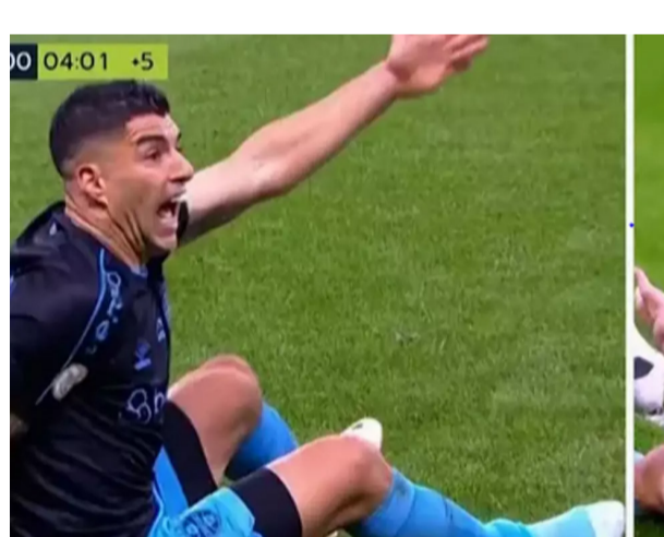
മൈതാനത്ത് വീണുകിടക്കുകയായിരുന്നു സുവാദസ്. ഹാളിന്റെ വ്യാപ്തി റഫറിയിലെ ഫോയറിലൂടെ സുവാദസ് തന്നെയായിരുന്നു മൗണ്ട് ഓഫ് ദ മാച്ച്.