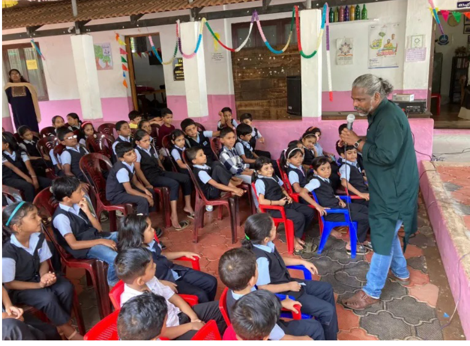
തലക്കുളത്തൂർ വി.കെ റോഡ് എം.എ.എൽ.പി സ്കൂളിലെ വായനാദിനാചരണവും വിദ്യാരംഗം കലാസാഹിത്യ വേദിയും ഉദ്ഘാടനം ചെയ്തശേഷം കുട്ടികളുമായി സംവദിക്കുന്ന ശിഷ്യ ആന