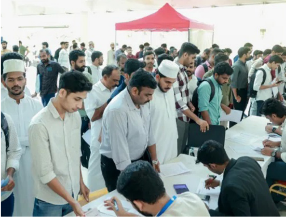
മർകസ് നോളജ് സിറ്റിയിൽ വച്ച് സംഘടിപ്പിച്ച ഹയർ സ്പോട്ട് തൊഴിൽ മേളയിൽ നിന്ന്