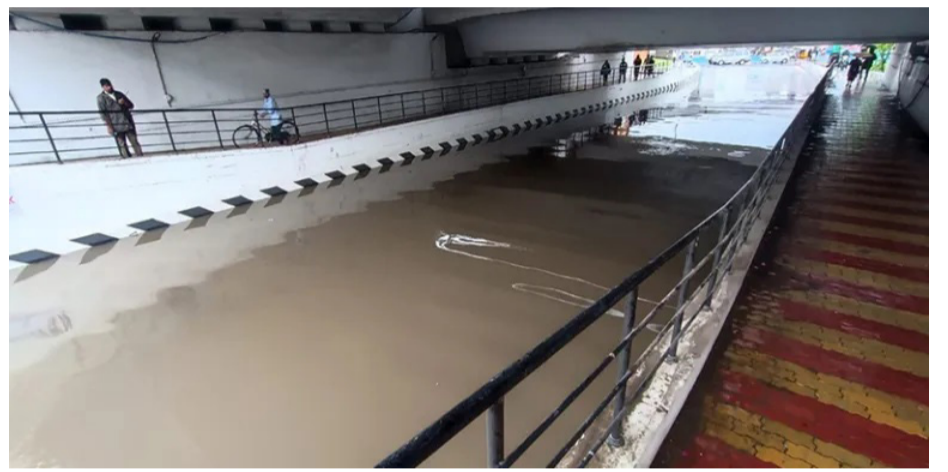
ചെന്നൈയിലെ കരിപ്പാ സബ്വേയുടെ അടിയിൽ നിന്നുള്ള കാഴ്ച

ചെന്നൈ: ശക്തമായ മഴയിൽ മുങ്ങി ചെന്നൈ. ചെന്നൈയെ കൂടാതെ തഞ്ചാവൂർ, രാമനാഥപുരം, നാഗപട്ടണം, തിരുവാതുർ, കൂഡല്ലൂർ, വില്ലുപുരം, മലിയാടുതുറൈ, ചെങ്കൽപേട്ട്, കാഞ്ചിപുരം, കള്ളകുറിച്യ, തിരുവള്ളൂർ, അരിയലൂർ, പെരുംബലൂർ, ശിവഗംഗ, പട്ടുച്ചേരി, കാരക്കൽ എന്നിവിടങ്ങളിലും ശക്തമായ മഴ പെയ്തുകൊണ്ടിരിക്കുന്നു. ചെന്നൈ നഗരത്തിൽ റോഡുകളിലാകെ വെള്ളം കയറി ഗതാഗതം തടസപ്പെട്ടു. പലയിടങ്ങളിലും മരങ്ങൾ കടപുഴകി വീണു. ഇന്റർനെറ്റ് കേബിളുകളും മറ്റ് ആശയവിനിമയ സംവിധാനങ്ങളും തകർന്നുപോയി. തെക്കുപടിഞ്ഞാറൻ മൺസൂണിന്റെ വരവിനെത്തുടർച്ചയായി മഴ മണിക്കൂറുകളോളം ശക്തമായി പെയ്തു. പിന്നീട് ശക്തി കുറഞ്ഞ് മഴ തുടർന്നതോടെയാണ് നഗരം വെള്ളത്തിൽ മുങ്ങിയത്.