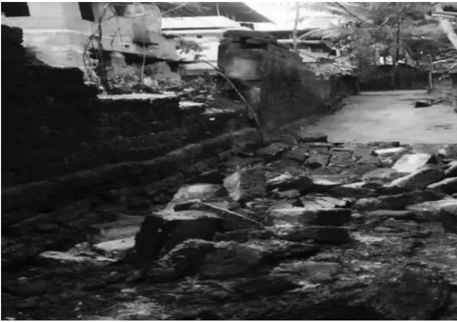
സൈദാർ പള്ളി വിവേക് റോഡിൽ ചെങ്കൽ മതിൽ ഇടിഞ്ഞുവീണപ്പോൾ