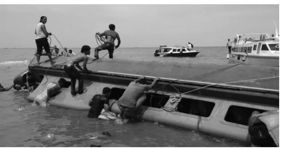
മധ്യ വടക്കൻ നൈജീരിയയിലെ ക്വാറിലെ അപകടത്തിൽപ്പെട്ട ബോട്ടിൽ രക്ഷാപ്രവർത്തനം നടത്തുന്നവർ

അബുജ: നൈജീരിയയിൽ ബോട്ട് മറിഞ്ഞ് 103 പേർ മരിച്ചു. മധ്യ വടക്കൻ നൈജീരിയയിലെ ക്വാർ സംസ്ഥാനത്താണ് തികളാഴ്ച പാലുവയോടെയാണ് അപകടം നടന്നത്. നൈജീരിയ എസ് ബോട്ടി ഗ്രാമത്തിൽ നടന്ന വിവാഹ ചടങ്ങിൽ പങ്കെടുത്ത് മടങ്ങുന്നതിനിടെയാണ് അപകടം. അപകടത്തിൽ 103 പേർ മരിച്ചെന്നും നിരവധി പേരെ കാണാതായെന്നും അധികൃതർ പറയുന്നു. പുലർച്ചെ മുന്ന് മണിക്കാണ് അപകടം സംഭവിച്ചത്. ബോട്ടിലുണ്ടായിരുന്ന ഭൃതിഭാഗം ആളുകളും മരിച്ചു. പലരുടെയും മൃതദേഹങ്ങൾ തിരിച്ചറിഞ്ഞിട്ടില്ല. രക്ഷാപ്രവർത്തനം നടന്നുകൊണ്ടിരിക്കുകയാണ് ക്വാർ പോലീസ് വ്യക്തമാക്കി. ബോട്ടിൽ എത്രപേർ ഉണ്ടായിരുന്നു എന്ന് തിരിച്ചറിയാൻ നൈജീരിയൻ പ്രാദേശിക ദിനപത്രമായ നൈജീരിയൻ ട്രിബ്യൂൺ