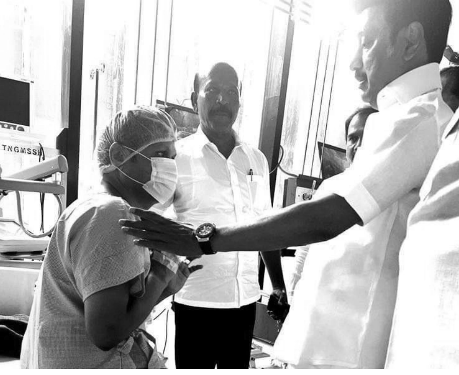
തമിഴ്നാട് മുഖ്യമന്ത്രി എം.കെ സ്റ്റാലിൻ ചെന്നൈയിലെ ഓമന്മുരൂർ ഗവ.ആശുപത്രിയിലെത്തി സെന്റിൽ ബാലാജിയെ സന്ദർശിച്ചപ്പോൾ

ചെന്നൈ: തമിഴ്നാട് വൈദ്യുതി-എക്സൈസ് വകുപ്പ് മന്ത്രി സെന്റിൽ ബാലാജിയെ ഇ.ഡി അറസ്റ്റ് ചെയ്തു. ജയലളിത മന്ത്രിസഭയിൽ ഗതാഗതമന്ത്രിയായിരിക്കെ ജോലി നൽകുന്നതിന് കോഴ ആവശ്യപ്പെട്ടെന്ന് കേസിലാണ് ഇ.ഡി അറസ്റ്റ്. 17 മണിക്കൂർ ചോദ്യം ചെയ്ത ശേഷം ആണ് അറസ്റ്റ് രേഖപ്പെടുത്തിയത്. അറസ്റ്റ് രേഖപ്പെടുത്തിയതിന് പിന്നാലെ സെന്റിൽ ബാലാജിയെ നെഞ്ചുവേദനയെ തുടർന്ന് ആശുപത്രിയിൽ പ്രവേശിപ്പിച്ചു. അറസ്റ്റിൽ പ്രതിഷേധവുമായി ഡി.എം.കെ രംഗത്തേറി. അറസ്റ്റ് നിയമവിരുദ്ധമെന്നും നിയമപരമായി നേരിട്ടുവെന്നും ഡി.എം.കെ പറഞ്ഞു. മുഖ്യമന്ത്രി എം.കെ സ്റ്റാലിൻ, ഉദയനീഡി സ്റ്റാലിൻ ഉൾപ്പെടെയുള്ള മറ്റ് മന്ത്രിമാർ ആശുപത്രിയിലെത്തി ബാലാജിയെ സന്ദർശിച്ചു. ബി.ജെ.പി വിരട്ടിയോൽ പേടിക്കില്ലെന്ന് ഉദയനീഡി സ്റ്റാലിൻ പ്രതീകരിച്ചു. ഓമന്മുരൂർ മെഡിക്കൽ കോളേജിലാണ് ഇപ്പോൾ സെന്റിൽ ബാലാജിയുള്ളത്. കനത്ത സുരക്ഷയാണ് ആശുപത്രിയിൽ നൽകിയത്.