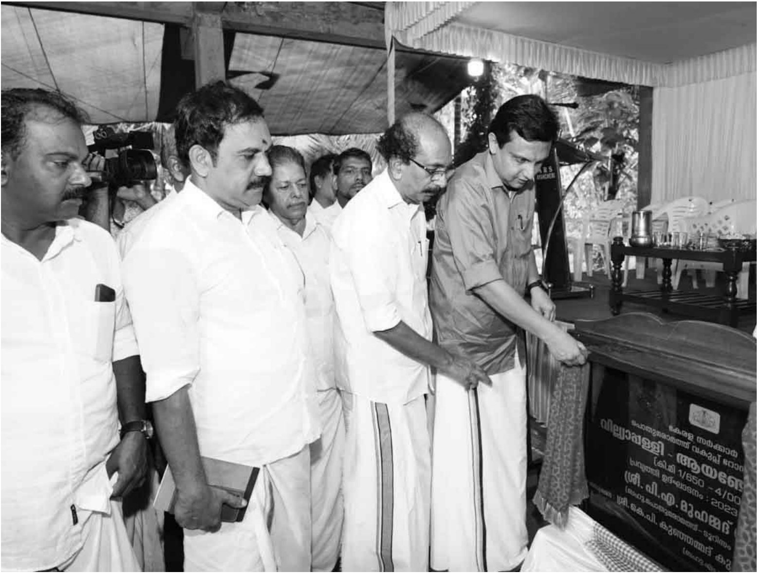
കുറുപ്പി മണ്ഡലത്തിലെ നവീകരണ പ്രവൃത്തി പൂർത്തിയാക്കി പൊക്ലാർത്താഴ-മാണിക്കോത്ത് താഴെ-പള്ളിയത്ത് റോഡ്, പ്രവൃത്തി ആരംഭിക്കുന്ന വില്ലാപ്പള്ളി-ആയഞ്ചേരി റോഡ്, തിരുവള്ളൂർ-ആയഞ്ചേരി റോഡുകളുടെ ഉദ്ഘാടനം പൊതുമാർഗ്ഗം വകുപ്പ് മന്ത്രി പി.എ. മുഹമ്മദ് റിയസ് നിർവഹിക്കുന്നു