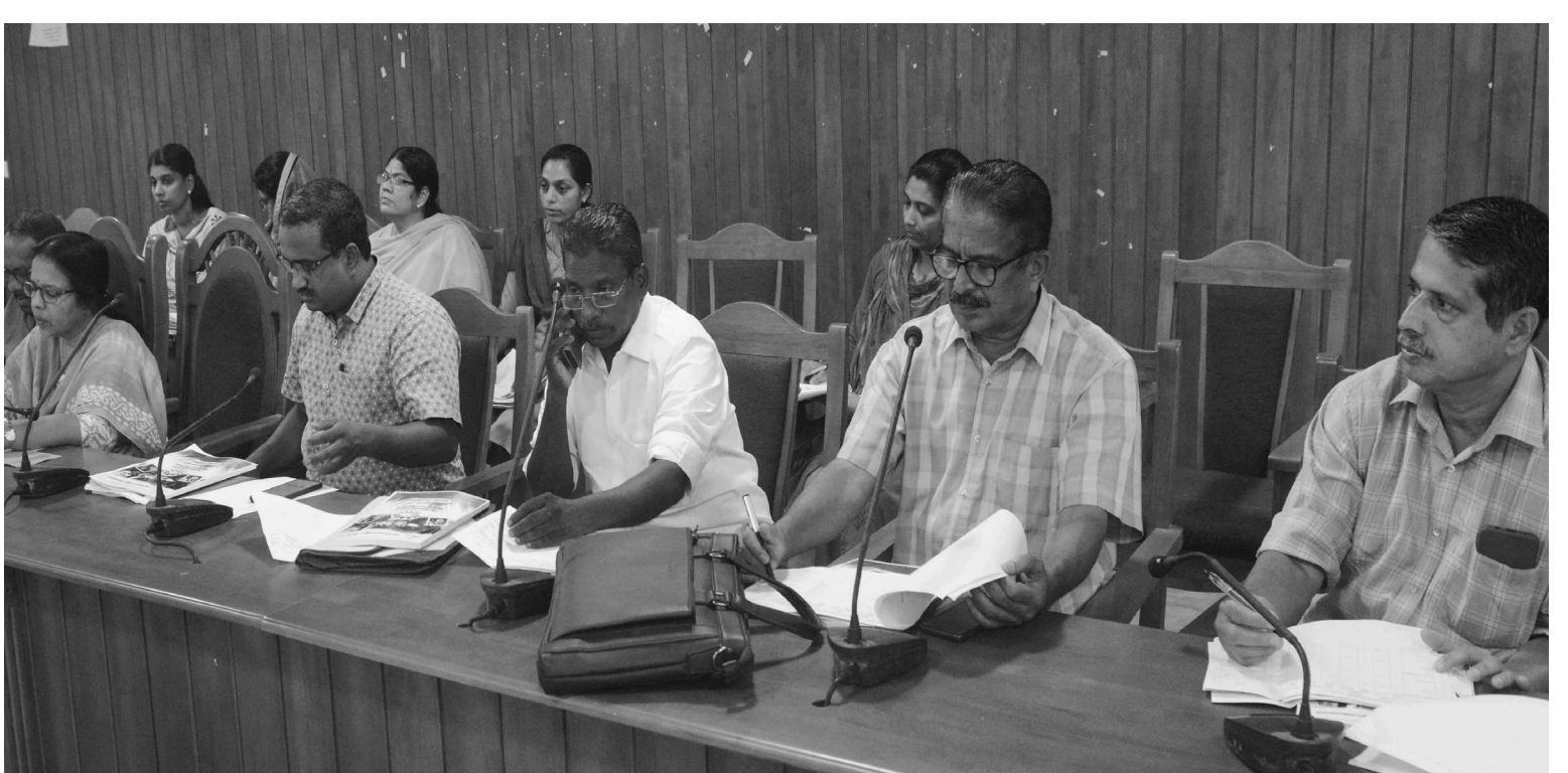
ആസൂത്രണ സമിതി സെക്രട്ടേറിയറ്റ് കോൺഫറൻസ് ഹാളിൽ ചേർന്ന ജില്ലാ ആസൂത്രണ സമിതി യോഗം

വിപണിയിൽ പുരോഗതി പ്രകടമായി തുടങ്ങിയത്. 2023 മാർച്ച് 31ന് അവസാനിച്ച പാദത്തിൽ ഒരു ലക്ഷം മറികടന്നത്. മദ്രാസ് റബ്ബർ ഫാക്ടറി എന്ന കമ്പനിയുടെ ചുരുക്കപ്പേരാണ് എം.ആർ.എഫ്. 1993 ഏപ്രിൽ 27നാണ് കമ്പനി വിപണിയിൽ ലിസ്റ്റ് ചെയ്തത്. 11 രൂപയിൽ ആരംഭിച്ച ഓഹരി 10 രൂപയ്ക്ക് കൈമാറ്റം ചെയ്തത്. 2022 ഡിസംബറിൽ ഓഹരി വില 94,500 രൂപയായി ഉയർന്നെങ്കിലും ആ നില നിലനിർത്തിയതിൽ പരാജയപ്പെട്ടിരുന്നു. മെയ് മുനിൻ ശേഷമാണ് എം.ആർ.എഫിന്റെ ഓഹരി