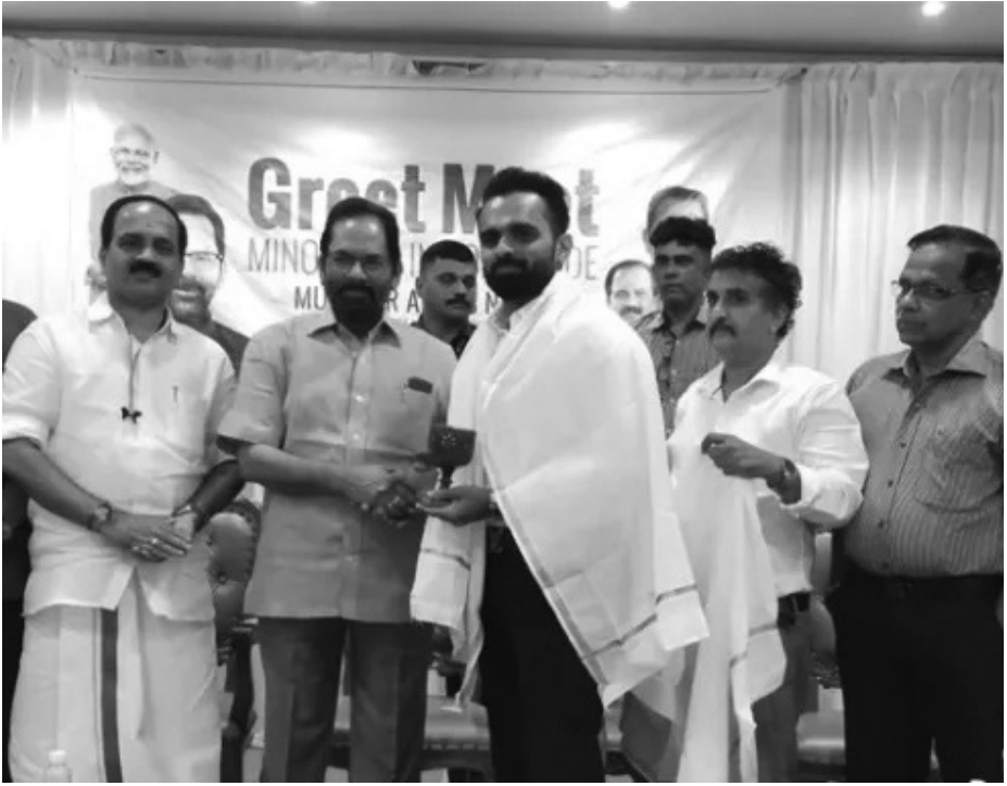
ന്യൂനപക്ഷ മോർച്ച സംഗമം ഗ്രീറ്റ് മീറ്റിംഗിൽ നിന്ന്