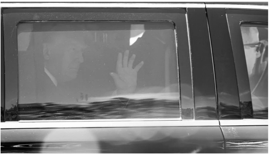
മിയാമി ഫെഡറൽ കോർട്ടിലെ കോർട്ടിലെ പ്രസിഡന്റ് ഡോണാൾഡ് ട്രംപിന്റെ ചിത്രം