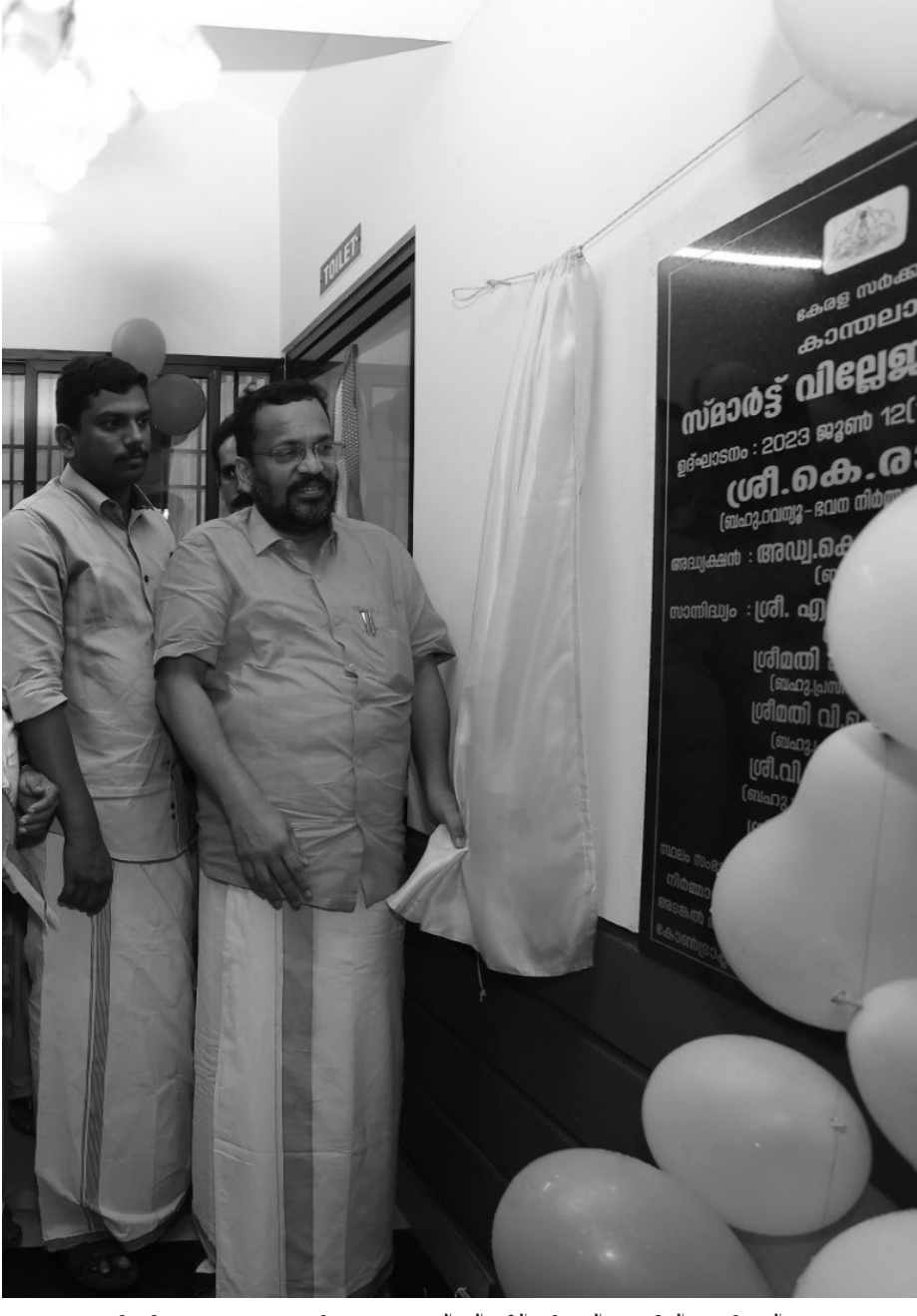
ബാലുശ്ശേരി നിയോജകമണ്ഡലത്തിലെ കാതലാട് സ്മാര്ട് വില്ലേജ് ഓഫീസ് കെട്ടിപ്പോടോടൊപ്പം റവന്യൂ മന്ത്രി കെ.രാജൻ നിർവഹിക്കുന്നു

ചെയ്യണമെന്നാണ് പ്രദേശവാസികളുടെ ആവശ്യം. അപകടം നടന്നതിന് ശേഷം നടപടികളുമായി പരാക്കം പായുന്നതിനു പകരം അപകടം നടക്കുന്നതിന് മുമ്പ് ജനങ്ങളുടെ ജീവൻ സുരക്ഷ നൽകാൻ ബന്ധപ്പെട്ടവർ തയ്യാറാവണമെന്നും നാട്ടുകാർ ആവശ്യപ്പെട്ടു.