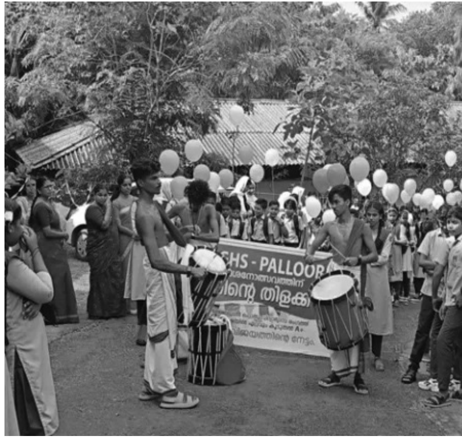
പള്ളൂർ കസ്തുർബ ഗാന്ധി ഗവ. ഹൈസ്കൂളിലെ പ്രവേശനോത്സവത്തിൽ നിന്ന്

അതിനാൽ പി.എസ്.സി ഇനി നടത്താൻ പോകുന്ന എം.ഒ.പി പരീക്ഷയെങ്കിലും മലയാളത്തിലും കുടി എഴുതാനുള്ള സാഹചര്യം ജീവനക്കാർക്ക് ഉണ്ടാക്കണമെന്നും അതിനു വേണ്ടി കെ.പി.എസ്. സിക്ക് ആവശ്യമായ നിർദ്ദേശങ്ങൾ നൽകണമെന്നും എച്ച്.ഡി.ഡ് സ്കൂൾ മിനിസ്റ്റീരിയൽ സ്റ്റാഫ് അസോസിയേഷൻ സംസ്ഥാന കമ്മിറ്റി സർക്കാരിനോടാവശ്യപ്പെട്ടിട്ടുണ്ട്.