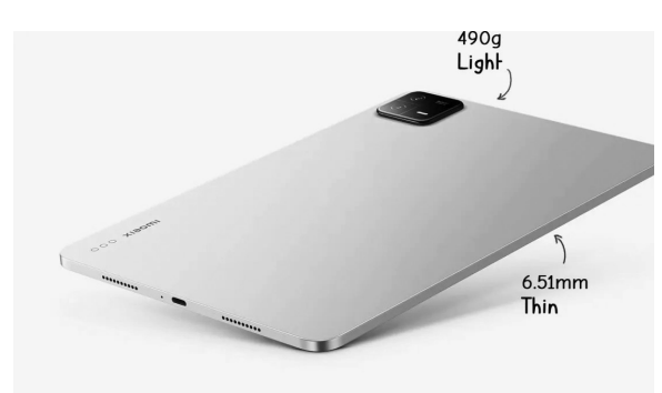
വാട്ട് അതിവേഗ ചാർജിങ്ങ് എന്നിവയുമുണ്ട്. പുതിയ സ്മാർട്ട് 5.5 കിബോർഡ് ഷാവോമി പാഡ് 6 6.5 കിബോർഡ്

ഷാവോമിയിലെ പുതിയ ഷാവോമി പാഡ് 6 പുറത്തിറക്കി. ഇതിന്റെ 11 ഇഞ്ച് 2.8 കെ ഡിസ്പ്ലേയിൽ 144 ഹെർട്സ് റിഫ്രഷ് റേറ്റ്, എച്ച്ഡിആർ10, ഡോൾബി വിഷൻ തുടങ്ങിയ സൗകര്യങ്ങളുണ്ട്. മറ്റൊരു യൂണിബോഡി ഡിസൈനാണിതിന്. സ്മാർട്ട്ഫോൺ 870 പ്രോസസറിൽ എച്ച് ജിബി വരെ റാം ഉണ്ട്. നാല് സ്പീക്കറുകൾ, നാല് മൈക്രോഫോണുകൾ, ഡോൾബി അറ്റ്മോസ് ശബ്ദ സംവിധാനം എന്നിവയുമുണ്ട്. 8840 എംഎച്ച്ബി ബാറ്ററിയിൽ 33