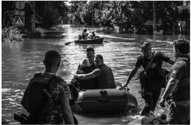
ഖേഴ്സൺ വെള്ളപ്പൊക്കത്തിൽ കുടുങ്ങിയവരെ സുരക്ഷിത സ്ഥാനത്തേക്ക് മാറ്റുന്ന ഔത്യസേന