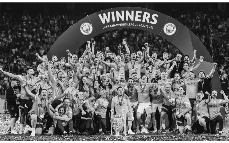
യുവേഫ ചാമ്പ്യൻസ് ലീഗ് കിരീടവുമായി മാഞ്ചസ്റ്റർ സിറ്റി ടീം

ഇസ്താംബുൾ: ഇംഗ്ലീഷ് പ്രീമിയർ ലീഗിനും എഫ്.എ കപ്പിനും പിന്നാലെ സീസണിൽ മൂന്നാമത്തെ കിരീടം നേടി മാഞ്ചസ്റ്റർ സിറ്റി. യുവേഫ ചാമ്പ്യൻസ് ലീഗ് ഫൈനലിൽ ഇന്റർമിലാനെ എതിരില്ലാത്ത ഒരു ഗോളിന് പരാജയപ്പെടുത്തിയാണ് സിറ്റി തങ്ങളുടെ ആദ്യ ചാമ്പ്യൻ ലീഗ് കിരീടം നേടിയത്. കളിയുടെ 880 മിനിറ്റിൽ റോഡ്രിഗിയുടെ യാണ് മാഞ്ചസ്റ്റർ സിറ്റി വിജയഗോൾ നേടിയത്. സിറ്റി അനായസം ജയിച്ചു കയറുമെന്ന് വിചാരിച്ചവർക്ക് തെറ്റി. ഇന്റർമിലാന്റെ പോരാട്ട വീര്യത്തിന് മുന്നിൽ സിറ്റിക്ക് കാലിടറുമോ എന്നുപോലും കടുത്ത സിറ്റി ആരാധകർ കരുതിയിരുന്നു. ആദ്യപാതിയിൽ സിറ്റിയുടെ താളം കളയാൻ ഇന്ററിന് നന്നായി സാധിച്ചു.