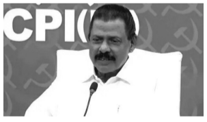
മാധ്യമങ്ങളോടൊപ്പം സ്പോർട്ട്സിലെ നിൽക്കാവുന്ന അന്വേഷണത്തിന്റെ ഭാഗമായി തെറ്റ് ചെയ്തെന്ന് കണ്ടെത്തിയാൽ ആരായാലും അന്വേഷണത്തിന് കേസെടുക്കും. ഗുഡലോചന

തിരുവനന്തപുരം: മാർക്ക് ലിസ്റ്റ് വിവരങ്ങൾ പിന്നിലെ ഗുഡലോചന പരാതിയിൽ ഏഷ്യാനെറ്റ് റിപ്പോർട്ടറും പങ്കാളിയുമാണ് സി.പി.എം സംസ്ഥാന സെക്രട്ടറി എം.വി ഗോവിന്ദൻ. സർക്കാർ വിരുദ്ധ, എസ്.എഫ്.ഐ വിരുദ്ധ പ്രചാരണം നടത്തിയാൽ ഇനിയും കേസെടുക്കുമെന്നും ഇതിന് മുന്നും ഇങ്ങനെ ചെയ്തിട്ടുണ്ടെന്നും അദ്ദേഹം പറഞ്ഞു. മാധ്യമങ്ങൾ