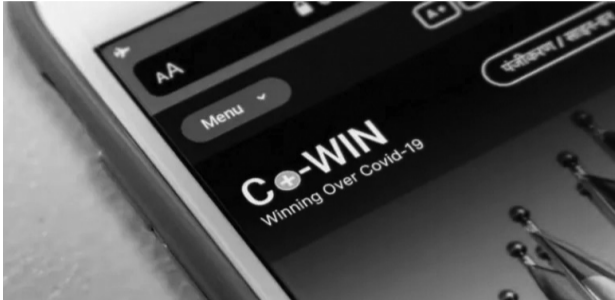
സമയത്ത് നൽകിയ വ്യക്തി വിവരങ്ങൾ ദേശശാലിലൂടെ ചോർന്നത് ദേശ സുരക്ഷയെ പോലും ബാധിക്കുന്ന വിഷയമാണെന്ന് പ്രതിപക്ഷം വിമർശിച്ചിരുന്നു.