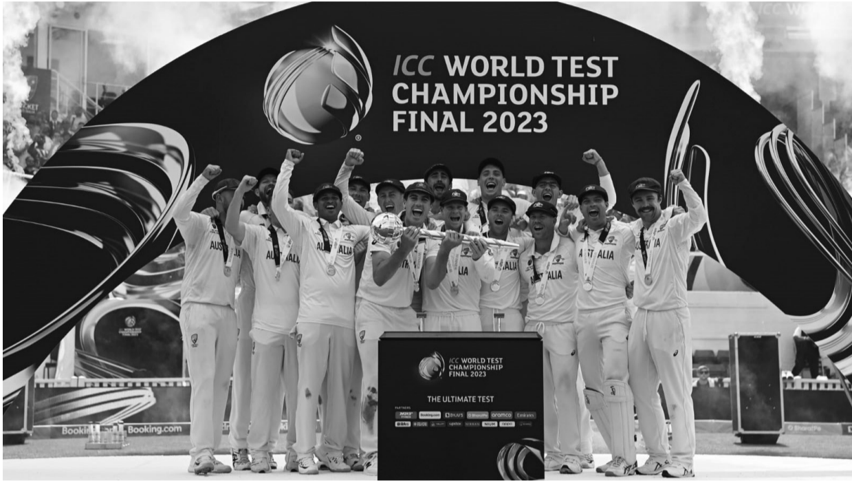
ലോക ടെസ്റ്റ് ചാമ്പ്യൻഷിപ്പ് കിരീടവുമായി ആസ്ട്രേലിയൻ ടീം

ലോക ടെസ്റ്റ് ചാമ്പ്യൻഷിപ്പ് കിരീടം ആസ്ട്രേലിയക്ക്. ഫൈനലിൽ ഇന്ത്യയെ 209 റൺസിന് പരാജയപ്പെടുത്തി