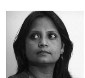
സുപ്രീം സഹ എൻ.എ.എസ്. എൻ. അവർ ട്വിറ്റ് ചെയ്തത്. എന്താൽ, അരികൊമ്പൻ

ചെന്നൈ: 'അരികൊമ്പൻ സുഖമായി ഇരിക്കുന്നു' എന്ന വ്യാജമായ പോസ്റ്റ് ഇട തമിഴ്നാട് അഡീഷണൽ ചീഫ് സെക്രട്ടറിയുടെ ട്വിറ്റ് വിവാദത്തിൽ. സുപ്രീം സഹ എൻ.എ.എ.എസ്.കാരിയാണ് അരികൊമ്പൻ ഒരു കാട്ടിൽ കിടന്ന് ഉറങ്ങുന്ന ചിത്രം പങ്കുവെച്ചിട്ട് വെട്ടിലായിരിക്കുന്നത്. അവർ ഒരു ബേബിയിൽ പോലെ പാപ്പയുടെ മുക്കിൽ കിടന്ന് ഉറങ്ങുന്നു എന്ന