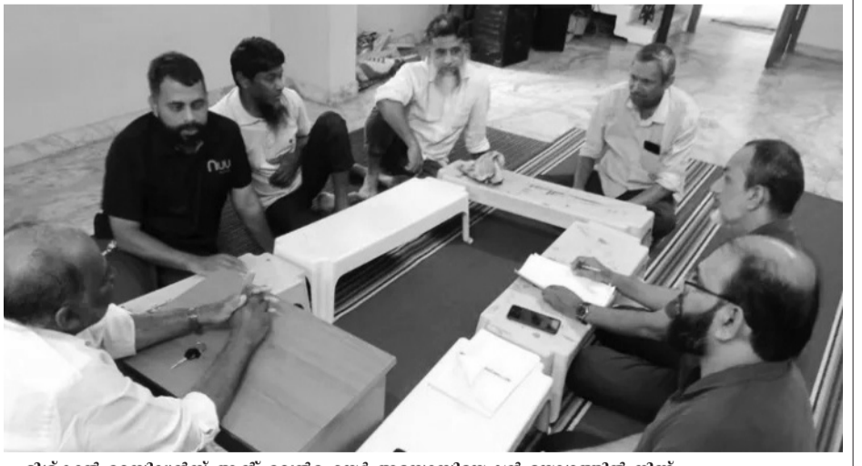
മിശ്കാൻ റെസിഡൻസ് ആന്റ് വെൽഫെയർ അസോസിയേഷൻ യോഗത്തിൽ നിന്ന്