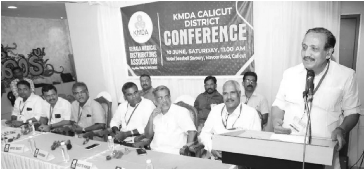
കേരള മെഡിക്കൽ ഡിസ്ട്രിബ്യൂഷൻ അസോസിയേഷൻ (കെ.എം.ഡി.എ) ജില്ലാ സമ്മേളനം ഉദ്ഘാടനം ചെയ്ത് സംസാരിക്കുന്ന എം.കെ രാഘവൻ എം.പി