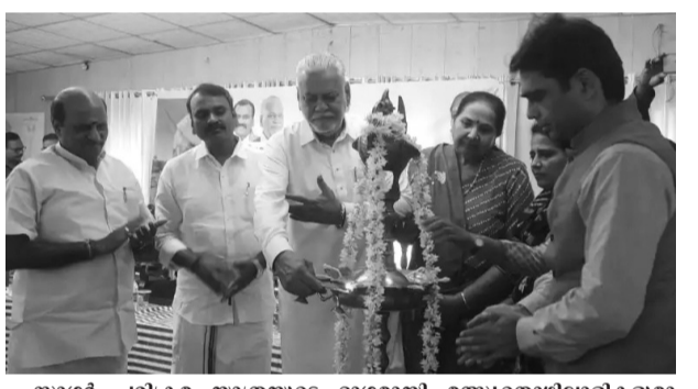
സാഗർ പരിക്രമ യന്ത്രങ്ങളുടെ ഭാഗമായി മത്സ്യതൊഴിലാളികളുമായുള്ള മുഖാമുഖം ഉദ്ഘാടനം ചെയ്യുന്ന കേന്ദ്രമന്ത്രി പർഷോത്തം രൂപാല

മാഹി: മാഹിയിലെ മത്സ്യതൊഴിലാളികൾക്ക് കിസാൻ ക്രെഡിറ്റ് കാർഡ് ഉൾപ്പെടെയുള്ള കേന്ദ്ര സർക്കാരിന്റെ ക്ഷേമ പദ്ധതികളുടെ ആനുകൂല്യങ്ങളായും കാലതാമസമില്ലാതെ ലഭ്യമാക്കുമെന്ന് കേന്ദ്ര ഫിഷറീസ് മന്ത്രി പർഷോത്തം രൂപാല പറഞ്ഞു. മാഹി സിവിൽ സ്റ്റേഷൻ ഓഡിറ്റോറിയത്തിൽ സാഗർ പരിക്രമ പദ്ധതിയുടെ ഭാഗമായെത്തിയതായിരുന്നു മന്ത്രി. കേന്ദ്ര ഫിഷറീസ് സഹ മന്ത്രി ഡോ.എൽ. മുരുകൻ ചടങ്ങിൽ അധ്യക്ഷത വഹിച്ചു. മത്സ്യതൊഴിലാളികളുമായി മുന്തിമാർ കൂടിക്കാഴ്ച നടത്തി. പാതിവഴിയലായ മത്സ്യ മത്സ്യബന്ധന തുറമുഖത്തിന്റെ നിർമ്മാണം പൂർത്തിയാക്കണമെന്നും, പെട്രോൾ ഉപയോഗിച്ച് പ്രവർത്തിക്കുന്ന ചെറുകിട മത്സ്യബന്ധന ബോട്ടുകൾക്കും സബ്സിഡി അനുവദിക്കണമെന്നും, എം.ബി.സി പട്ടികയിൽ ഉൾപ്പെടുത്തി,