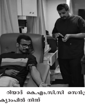
റിയാദ് കെ.എം.സി.സി സെൻട്രൽ കമ്മിറ്റി സംഘടിപ്പിച്ച രക്തദാന ക്യാമ്പിൽ നിന്ന്

റിയാദ്: ഈ വർഷം ഹജ്ജ് കർമ്മ നിർവഹിക്കാനെത്തുന്ന ഹാജിമാരെ സഹായിക്കുന്നതിനായി റിയാദ് കെ.എം.സി.സി സെൻട്രൽ കമ്മിറ്റി രക്തദാന ക്യാമ്പ് സംഘടിപ്പിച്ചു. കിംഗ് സയ്ദി മെഡിക്കൽ സിറ്റിയുമായി സഹകരിച്ച് നടത്തിയ ക്യാമ്പിൽ സ്ത്രീകളടക്കം നാനൂറോളം പേർ രക്തദാനം ചെയ്തു. റിയാദ് കെ.എം.സി.സിയുടെ ഫുട്ബോൾ ടൂർണമെന്റ് നടക്കുന്ന അസീസിയിലെ അൽമസാന അസീസ്