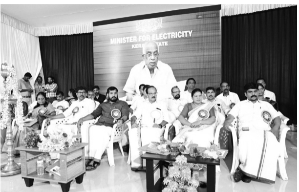
പുതുപ്പാടി ഇലക്ട്രിക്കൽ സെക്ഷൻ ഓഫീസിന്റെ പുതിയ കെട്ടിടം വൈദ്യുതി വകുപ്പ് മന്ത്രി കെ. കൃഷ്ണൻകുട്ടി ഓൺലൈനായി ഉദ്ഘാടനം ചെയ്യുന്നു