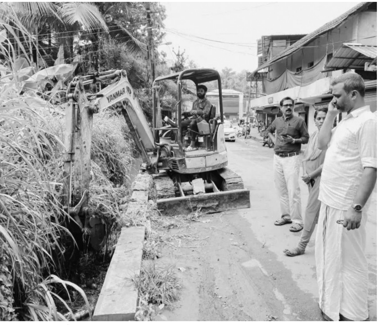
ജെ.സി.ബി ഉപയോഗിച്ച് ഡ്രൈനേജിലെ അടഞ്ഞുകൂടിയ മാലിന്യം പുറത്തൊഴുക്കുന്നു