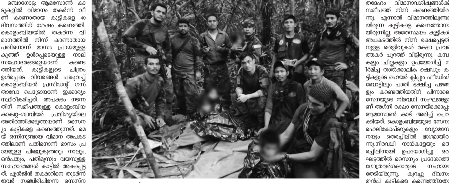
വിമാനം തകർന്ന് വനത്തിൽ അകപ്പെട്ട കുട്ടികളെ കൊളാബിയൻ സൈന്യം കണ്ടെത്തിയപ്പോൾ

വിമാനം തകർന്ന് വനത്തിൽ അകപ്പെട്ട കുട്ടികളെ കണ്ടെത്തിയത് 40 ദിവസത്തെ തിരച്ചിലിന് ശേഷം