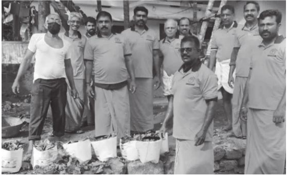
അത്തോളി ഗവ. എൽ.പി സ്കൂളിൽ സമ്പൂർണ്ണ ശുചീകരണ പ്രവൃത്തി നടത്തിയ സേവാഭാരതി അത്തോളി യൂണിയൻ അംഗങ്ങൾ