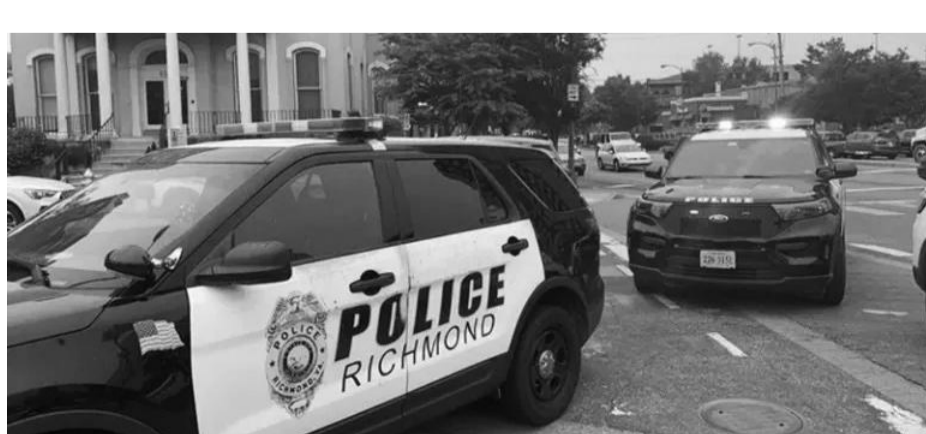
വെടിവെയ്പ്പുണ്ടായ സ്ഥലത്ത് റിപ്പബ്ലിക് പോലീസ് എത്തിയപ്പോൾ

വിർജീനിയ: യു.എസിൽ വീണ്ടും വെടിവെയ്പ്പ്. സംഭവത്തിൽ രണ്ടു പേർ കൊല്ലപ്പെടുകയും ഏഴ് പേർക്ക് പരുക്കേൽക്കുകയും ചെയ്തു. വിർജീനിയയിൽ കോമൺ വെൽത്ത് യൂണിവേഴ്സിറ്റിയിൽ സമീപമുള്ള തീയേറ്ററിൽ നടന്ന ഹൈസ്കൂൾ ബിരുദദാന ചടങ്ങിനിടെയാണ് ആക്രമണം. തിക്കിലും തിരക്കിലുപെട്ട് പരുക്കേറ്റ പന്ത്രണ്ട് പേരിൽ മൂന്ന് പേരുടെ നില ഗുരുതരമാണ്. ആക്രമണം നടത്തിയ രണ്ട് പേരെ അറസ്റ്റ് ചെയ്തതായി റിപ്പബ്ലിക് പോലീസ് മോഡറിൻ ഏഡ്മിനിസ്ട്രേഷൻ അറിയിച്ചു. തീയേറ്ററിനുള്ളിൽ ഉണ്ടായിരുന്ന ഉദ്യോഗസ്ഥർ വെടികൂട്ടി 5,150ഓടെ വെടിയൊച്ച കേൾക്കുകയും പോലീസ് സ്റ്റേഷനിൽ വിവരം അറിയിക്കുകയുമായിരുന്നു. തുടർന്ന് സംഭവസ്ഥലത്തെത്തിയ പോലീസ് പരുക്കേറ്റവരെ കണ്ടെത്തു