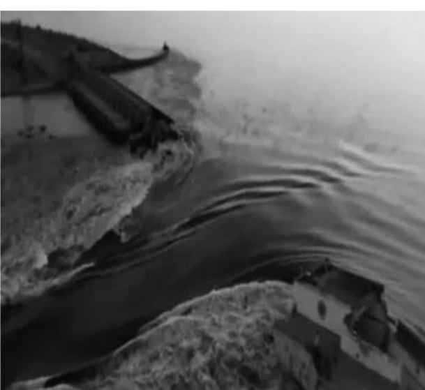
1. കബോവ്ക അണക്കെട്ട് തകർന്നതിന് മുമ്പ് 2. അണക്കെട്ട് തകർന്നതിന് ശേഷം

ണം നിഷേധിക്കുകയാണ് ചെയ്തത്. ആക്രമണത്തിന്റെ ഉത്തരവാദിത്വം ഏറ്റെടുക്കാതെ പരസ്പരം പഴിച്ചാരുതയാണ് യു.എന്നിലെ ഉക്രെയ്ൻ, റഷ്യ പ്രതിനിധികൾ. പ്രത്യാക്രമണത്തിന് സൈന്യത്തെ പുനഃസംഘടിപ്പിക്കാനായി അനുകൂല അവസരം സൃഷ്ടിക്കാൻ ഉക്രെയ്ൻ നടത്തിയ നീക്കമാണെന്ന് റഷ്യ ആരോപിക്കുന്നു. എന്നാൽ, റഷ്യ നടത്തിയ തീവ്രവാദ നീക്കമാണെന്ന് ഉക്രെയ്നും ആരോപിക്കുന്നു. വിഷയത്തിൽ റഷ്യയ്ക്കെതിരെ ഇതിനകം തന്നെ അന്താരാഷ്ട്ര ക്രിമിനൽ കോടതിയെ സമീപിച്ചതായി ഉക്രെയ്ൻ പ്രസിഡന്റ് വ്ലാഡിമിർ സെലൻസ്കി വ്യക്തമാക്കി. ഖേസണിൽ ആളുകളെ ഒഴിപ്പിക്കുന്നതിനിടെ റഷ്യൻ