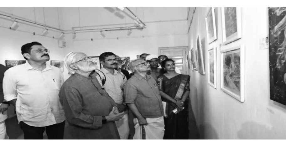
എം.വി.ദേവൻ ആർട്ട് ഗാലറിയിൽ നടക്കുന്ന 'ജലമർമ്മരം' ചിത്രപ്രദർശനം നോക്കിക്കൊണ്ടുനിൽക്കുന്ന എം.എ.എസ്.എഫ്