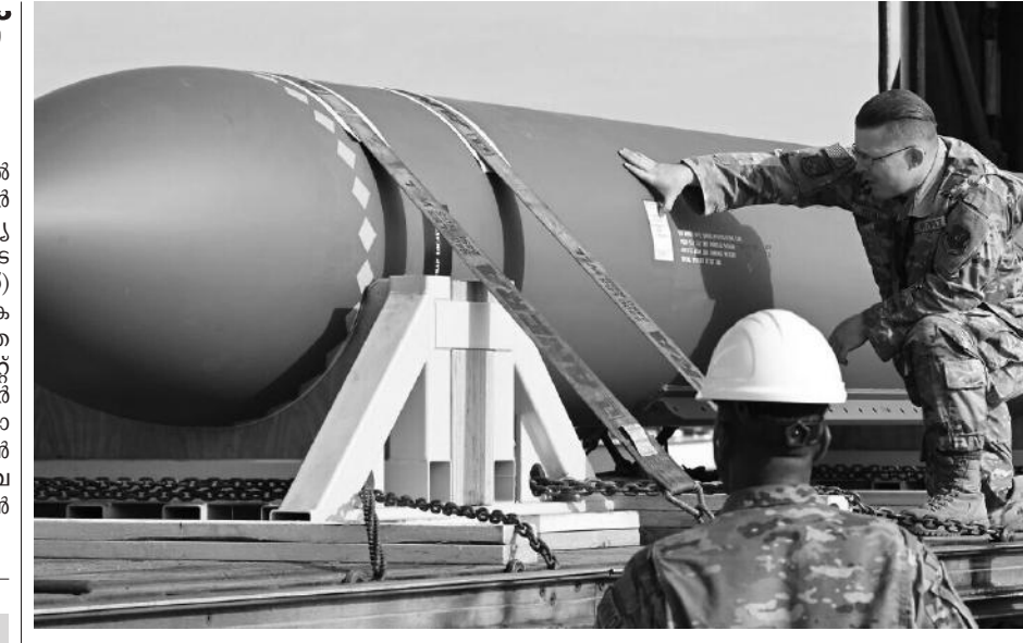
മിസോറിയയിലെ വെറ്റ്മാൻ വ്യോമസേനാ താവളത്തിന്റെ ഫെയ്സ്ബുക്ക് പേജിൽ പ്രസിദ്ധീകരിച്ച ജിബിയു 57 എന്ന ബോംബിന്റെ ചിത്രം

കോഴിക്കോട്: കേരള ബിൽഡിംഗ് ഓണറേഴ്സ് വെൽഫെയർ അസോസിയേഷന്റെ ആഭിമുഖ്യത്തിൽ കെട്ടിട, വീട്ടുടിമരണങ്ങൾ സെക്രട്ടേറിയറ്റ് ധർമ്മ നാളെ (24) രാവിലെ 11 മണിക്ക് നടക്കും.