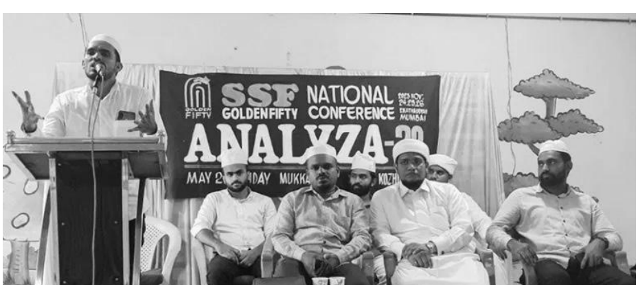
എസ്.എസ്.എഫ് കോഴിക്കോട് ജില്ലാ കമ്മിറ്റി മുഖേന സംഘടിപ്പിച്ച അനലൈസ ക്യാമ്പിൽനിന്ന്