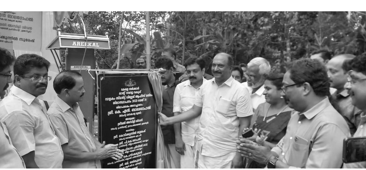
ആധുനികവൽക്കരിക്കുന്ന വാളകം സ്മാർട്ട് വില്ലേജ് ഓഫീസിന്റെ ശിലാസ്ഥാപന കർമ്മം മന്ത്രി കെ.എൻ ബാലഗോപാൽ നിർവഹിക്കുന്നു

കൊല്ലം: സമ്പൂർണ്ണ ഡിജിറ്റലൈസേഷൻ പദ്ധതിയിലൂടെ റവന്യൂ വകുപ്പിന്റെ സേവനങ്ങൾ കൂടുതൽ സുതാര്യമാകുമെന്ന് മന്ത്രി കെ.എൻ ബാലഗോപാൽ. ആധുനികവൽക്കരിക്കുന്ന വാളകം സ്മാർട്ട് വില്ലേജ് ഓഫീസിന്റെ ശിലാസ്ഥാപന കർമ്മം നിർവഹിച്ച സംസാരിക്കുകയായിരുന്നു അദ്ദേഹം. ഭൂരേഖ സംബന്ധിച്ചുള്ള സങ്കീർണ്ണതകൾ ഒഴിവാക്കാൻ സമ്പൂർണ്ണ ഡിജിറ്റലൈസേഷൻ ലക്ഷ്യമുണ്ട്. എല്ലാവിധ ആധുനിക സങ്കീർണ്ണതകളോടും കൂടിയാണ് ആവുകയാണെന്ന്. ആധുനികവൽക്കരിക്കുന്ന സ്മാർട്ട് വില്ലേജ് ഓഫീസുകൾ സങ്കീർണ്ണതകൾ കുറയ്ക്കുന്നതെന്നും മന്ത്രി പറഞ്ഞു. റവന്യൂ വകുപ്പിൽ നിന്നും അനുവദിച്ച 50 ലക്ഷം രൂപ ചെലവഴിച്ചാണ് ഹൈടെക് കെട്ടിടം നിർമ്മിക്കുക. ഭിന്ന