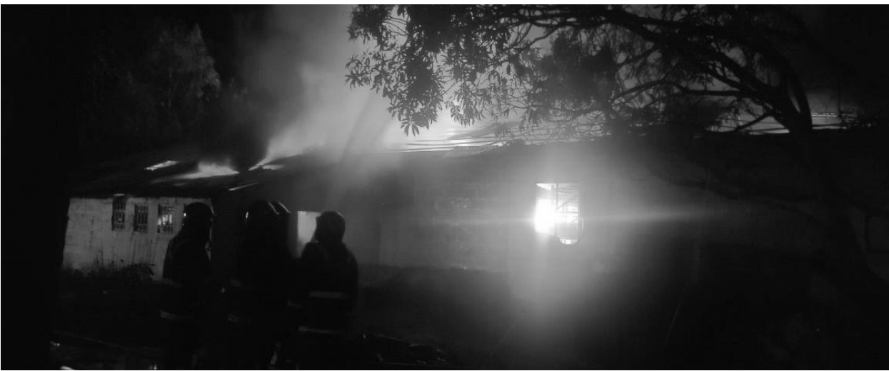
കിൻഫ്രപാർക്കിലുണ്ടായ തീപിടിത്തം അണയ്ക്കാൻ ശ്രമിക്കുന്ന ഫയർഫോഴ്സ് ജീവനക്കാർ

തിരുവനന്തപുരം: തുറന്ന കിൻഫ്ര പാർക്കിൽ വൻ തീപിടിത്തം. ഫയർഫോഴ്സ് ജീവനക്കാർന് ദാരുണാന്ത്യം.