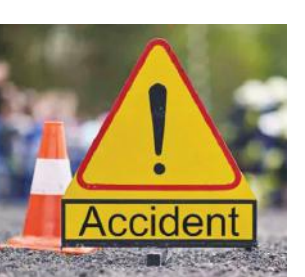
മഴുവഞ്ചിയിൽ വച്ച് എതിരെ വന്ന ടാറ്റാ സുയോദ്ധയായി കുട്ടിയിടിച്ച് ബസ് നിയന്ത്രണം നഷ്ടപ്പെട്ട് റോഡരികിലെ അടഞ്ഞുകിടന്നിരുന്ന കെട്ടിടത്തിലേക്ക് ഇടിച്ചു കയറുകയായിരുന്നു. അപകടത്തിൽ ബസ് യാത്രികരായ എട്ട് പേർക്കും ടാറ്റാ സുയോദ്ധയിലെ നാലു പേരും ഉൾപ്പെടെ 12 പേർക്ക് പരുക്കേറ്റു. ആരുടെയും പരുക്ക് ഗുരുതരമല്ല. നാട്ടുകാർക്ക് രക്ഷാപ്രവർത്തനത്തിന് നേതൃത്വം നൽകിയത്. പരുക്കേറ്റവരെ തൃശൂരിലെ സ്വകാര്യ ആശുപത്രിയിൽ പ്രവേശിപ്പിച്ചു.

തൃശൂർ: തൃശൂരിൽ വാഹനാപകടത്തിൽ 12 പേർക്ക് പരുക്ക്. സ്വകാര്യ ബസും കാറും കുട്ടിയിടിച്ച് അപകടമുണ്ടായത്. കുറുന്നൂറ്റും മഴുവഞ്ചിയിലാണ് സംഭവം. ഇന്ന് രാവിലെ 10 ഓടെയായിരുന്നു അപകടം.