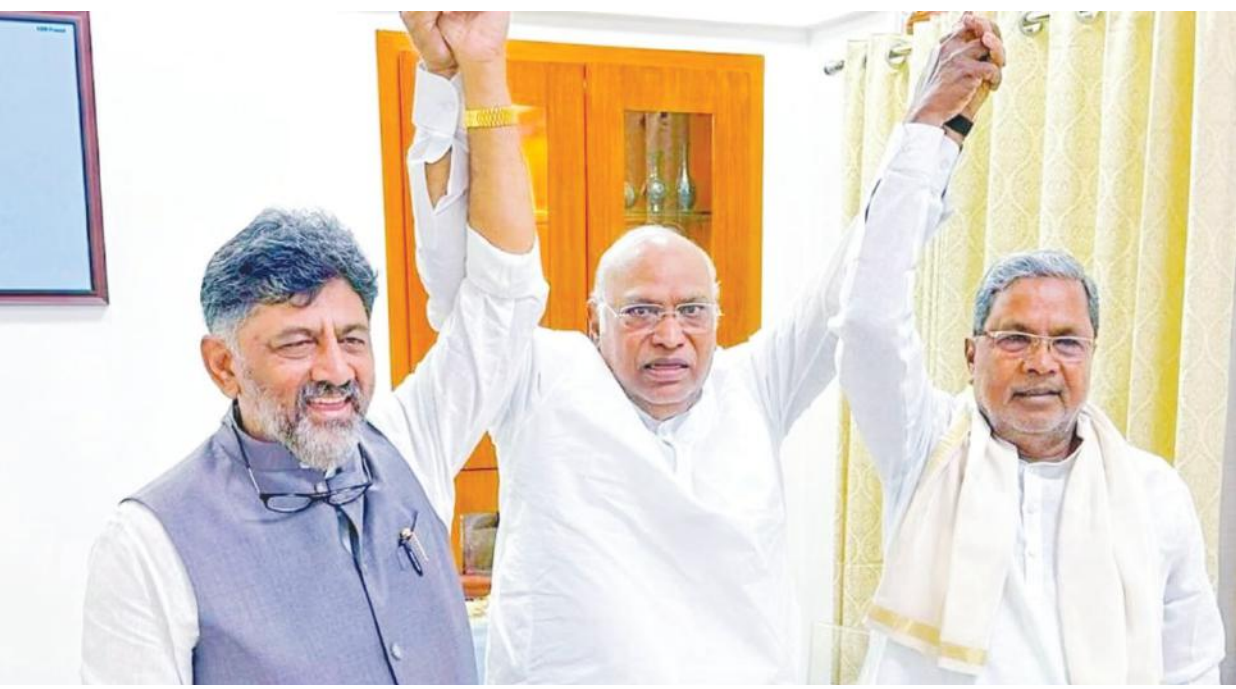
ഒരുമയോടെ തുടരാം... കർണാടക മുഖ്യമന്ത്രിയെ തിരഞ്ഞെടുത്തിന് പിന്നാലെ സർക്കാരിൽ കോൺഗ്രസ് അധ്യക്ഷൻ മല്ലികാർജുൻ ഖർഗെക്കെ സി.കെ. ശിവകുമാർ സിദ്ധരാമയ്യയും സന്ദർശിച്ചപ്പോൾ