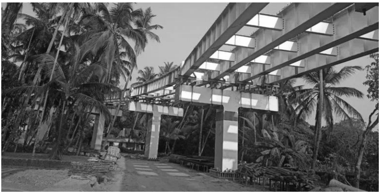
നിർമ്മാണത്തിലിരിക്കുന്ന കൊടുവള്ളി റെയിൽവേ മേൽപ്പാലം