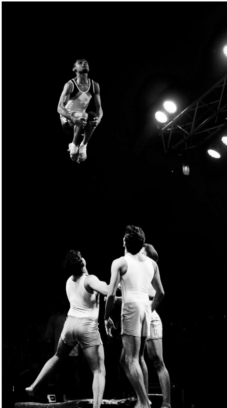
സംസ്ഥാന സർക്കാരിന്റെ രണ്ടാം വാർഷിക റിപ്പോർട്ടിന്റെ ഭാഗമായി കോഴിക്കോട് ബി.പി. ഓപ്പൺ സ്റ്റേജിൽ നടന്ന ജിംനാസ്റ്റിക് ഷോയിൽനിന്ന്