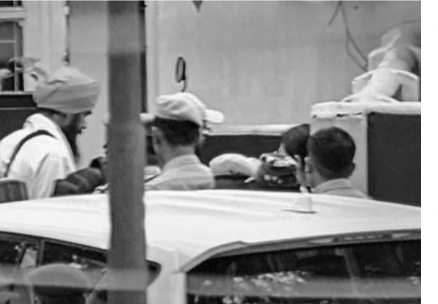
അമൃത്പാൽ സിംഗിനെ ദിബ്രൂഗഢ് ജയിലിൽ കൊണ്ടുവന്നപ്പോൾ

ന്യൂഡൽഹി: അറസ്റ്റിലായ വലിപ്പമേറിയ അനുകൂലിയും വാരിസ് പഞ്ചാബ് ഭേദ തലവനായ അമൃത്പാൽ സിംഗിനെ കേന്ദ്ര രഹസ്യാഗ്രേഷണ ഏജൻസികൾ ചോദ്യം ചെയ്യും. ഞായറാഴ്ച പഞ്ചാബ് പോലീസിന് കീഴടങ്ങിയ അമൃത്പാലിനെ മണിക്കൂറുകൾക്കകം തന്നെ അന്വേഷണ ഏജൻസികൾ ചോദ്യം ചെയ്യും. ഞായറാഴ്ച പഞ്ചാബ് പോലീസിന് കീഴടങ്ങിയ അമൃത്പാലിനെ മണിക്കൂറുകൾക്കകം തന്നെ അന്വേഷണ ഏജൻസികൾ ചോദ്യം ചെയ്യും. അതിവേഗ സുരക്ഷയുള്ള ദിബ്രൂഗഢ് ജയിലിലേക്ക് മാറ്റുകയായിരുന്നു. വടക്കുകിഴക്കൻ മേഖലയിലെ ഏറ്റവും പഴക്കമേറിയതും അതിവേഗ സുരക്ഷിതവുമായ ജയിലുകളിലൊന്നാണ് ഇത്. അന്വേഷണ ജയിലിലെ സെല്ലിൽ ഒറ്റയ്ക്കാണ് അമൃത്പാൽ സിംഗിനെ പാർപ്പിച്ചിരിക്കുന്നത്. സമാധാന അന്വേഷണം തകർക്കാൻ ശ്രമിക്കുന്നവർക്കെതിരെ കർമ്മ നടപടിയിടയാക്കുമെന്ന് പഞ്ചാബ് മുഖ്യമന്ത്രി ആവർത്തിച്ചു. അസം പോലീസിലെ ലഭ്യമായ വിവരങ്ങൾ സൂക്ഷിച്ച് ജയിലിലുള്ള സുരക്ഷ കൂട്ടി. ജയിലിൽ പ്രത്യേക നിരീക്ഷണം ഉറപ്പാക്കി ഒറ്റയ്ക്കാണ് അമൃത്പാലിനെ പാർപ്പിച്ചിരിക്കുന്നത്. പഞ്ചാബ് പോലീസിനും കേന്ദ്ര രഹസ്യാഗ്രേഷണ ഏജൻസിയും റോയലും ജയിലിൽ അമൃത്പാലിനെ ചോദ്യം ചെയ്യും. പഞ്ചാബ് പോലീസിലെ ലഭ്യമായ വിവരങ്ങൾ സൂക്ഷിച്ച് ജയിലിലുള്ള സുരക്ഷ കൂട്ടി. ജയിലിൽ പ്രത്യേക നിരീക്ഷണം ഉറപ്പാക്കി ഒറ്റയ്ക്കാണ് അമൃത്പാലിനെ പാർപ്പിച്ചിരിക്കുന്നത്.