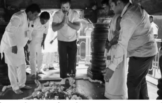
കർണാടകയിലെ ബഗൽക്കോട്ടയിലെ സാംസ്കാരിക അമ്പലത്തിലെ തൊഴിലാളികൾക്ക് സാംസ്കാരിക അമ്പലത്തിൽ

മിലേക്ക് മാറ്റിയതിന് പിന്നിലെ കാരണം പുറത്തു വിട്ടിട്ടില്ലെങ്കിലും ചില വ്യക്തികൾ സൂചിപ്പിക്കുന്നത്, ഇത്തരം സുരക്ഷിതമായ വിഷയങ്ങളിൽ അമൃത്പാൽ സിംഗിനെ അന്വേഷണ ഏജൻസികൾ ചോദ്യം ചെയ്യും. അതിവേഗ സുരക്ഷിതവുമായ ജയിലുകളിലൊന്നാണ് ഇത്. അന്വേഷണ ജയിലിലെ സെല്ലിൽ ഒറ്റയ്ക്കാണ് അമൃത്പാൽ സിംഗിനെ പാർപ്പിച്ചിരിക്കുന്നത്. സമാധാന അന്വേഷണം തകർക്കാൻ ശ്രമിക്കുന്നവർക്കെതിരെ കർമ്മ നടപടിയിടയാക്കുമെന്ന് പഞ്ചാബ് മുഖ്യമന്ത്രി ആവർത്തിച്ചു. അസം പോലീസിലെ ലഭ്യമായ വിവരങ്ങൾ സൂക്ഷിച്ച് ജയിലിലുള്ള സുരക്ഷ കൂട്ടി. ജയിലിൽ പ്രത്യേക നിരീക്ഷണം ഉറപ്പാക്കി ഒറ്റയ്ക്കാണ് അമൃത്പാലിനെ പാർപ്പിച്ചിരിക്കുന്നത്.