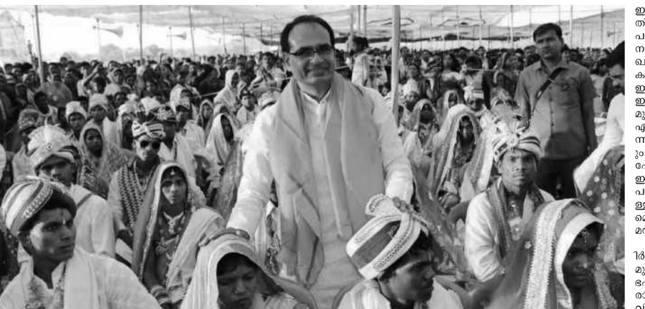
മുഖ്യമന്ത്രി കന്യാദാൻ യോജനയിലൂടെ വിവാഹിതരാകുന്നവരെപ്പോലും മധ്യപ്രദേശ് മുഖ്യമന്ത്രി ശിബ്ദാസ് സിംഗ് ചൗഹാൻ (ഫ്രണ്ട് ഫ്രണ്ട്)

മധ്യപ്രദേശിൽ സാമ്പത്തികമായി പിന്നോക്കം നിൽക്കുന്ന സ്ത്രീകൾക്കായുള്ള മുഖ്യമന്ത്രി കന്യാദാൻ യോജന വിവാഹ പദ്ധതിയിൽ വിവാദം പുകയുന്നു. യോഗ്യത നിശ്ചയിക്കാൻ വയ്ക്കാലിൽ ചിലരെ ഗർഭ പരിശോധനയ്ക്ക് വിധേയമാക്കിയിരുന്നതാണ് വിവാദത്തിലായിരിക്കുന്നത്. ഗർഭിണികളെ പരിശോധനയ്ക്ക് വിധേയമാക്കുന്നത് നീതികേടാണെന്ന് ആരോപിച്ച് വലിയ രാഷ്ട്രീയ വിവാദമാണ് ഉണ്ടായത്. ബി.ജെ.പി നേതൃത്വത്തിലുള്ള സർക്കാരിന്റെ നടപടിയെ തുടർച്ചയായി വിമർശിച്ച് രംഗത്തെത്തിയ കോൺഗ്രസ് പെൺകുട്ടികളുടെ അടിമാനത സർക്കാർ ചോദ്യം ചെയ്യുകയാണെന്ന് ആരോപിച്ചു. മുഖ്യമന്ത്രി കന്യാദാൻ യോജന പദ്ധതിയിൽ