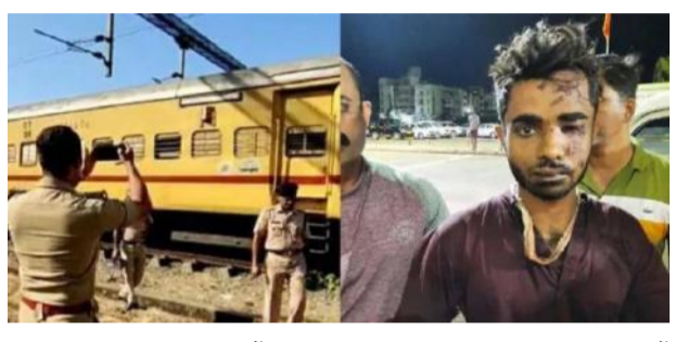
എൻ.ഐ.എ റിപ്പോർട്ട്. ട്രാക്കിൽ നിന്നും ലഭിച്ച ബോർഡ്

കൊച്ചി: എലത്തൂർ ട്രെയിൻ ആക്രമണ കേസിൽ കേരള പോലീസിനെതിരെ കേന്ദ്ര അന്വേഷണ ഏജൻസികൾ, സംഭവത്തിൽ പോലീസിന് ഗുരുതര വീഴ്ച സംഭവിച്ചുവെന്നാണ് കേന്ദ്ര ഏജൻസികളുടെ റിപ്പോർട്ട്. അന്വേഷണവുമായി കേരള പോലീസ് സഹകരിക്കുന്നില്ലെന്നും പരാതിയുണ്ട്. പോലീസിന്റെ പിഴവുകൾ അക്കമിട്ടു നിരത്തിയാണ്