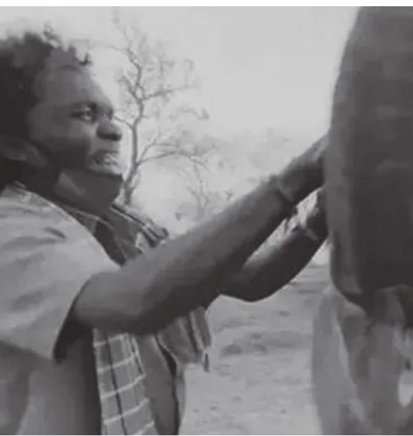
കുട്ടിയായതോടൊപ്പം ബോമ്മനും ബെല്ലിയും

ഉദ്ദി: ഓസ്കാർ പുരസ്കാരം നേടിയ 'ദി എലിഫന്റ്' വിസഫറേഴ്സ് എന്ന് ഹ്രസ്വചിത്രത്തിലൂടെ ശ്രദ്ധേയമായ പാപ്പാൻ ദമ്പതികൾ ബോമ്മനും ബെല്ലിയും സംരക്ഷിച്ചു വന്ന കുട്ടിക്കൊമ്പൻ പരിഞ്ഞു. ഇരുവർക്കും രണ്ടാഴ്ച മുൻ ലഭിച്ച നാലു മാസം പ്രായമുള്ള കുട്ടിയായാണ് പരിഞ്ഞത്. വയറിളക്കമാണ് മരണകാരണമെന്നാണ് വിവരം. മാർച്ച് 16 നാണ് നാലുമാസം പ്രായമുള്ള ആനകുട്ടിയെ ധർമ്മപുരിയിൽ നിന്ന് മുതുമല കടുവാ സങ്കേതത്തിലെ ആനക്കുറമ്പിലേക്ക് എത്തിച്ചത്. ഓസ്കാർ നേട്ടത്തിന്റെ തിളക്കത്തിലിരിക്കുന്ന ബോമ്മനേയും ബെല്ലിയേയും തന്നെയാണ് കുട്ടിക്കൊമ്പന്റെ മേൽനോട്ടം ഏൽപ്പിച്ചത്. ബോമ്മനോടും ബെല്ലിയോടും വലിയ ഇണക്കത്തിലായിരുന്നു ആനക്കുട്ടി. അമ്മയിൽ നിന്ന് വേർപെട്ടതിനാൽ അതിവേഗം നശിച്ചുപോയ ആനക്കുട്ടിയെ പരിചരിച്ചത്, അമ്മയില്ലാത്തതിനാൽ പാപ്പാൻ പകരം മനുഷ്യർക്ക് നൽകുന്ന ലാഭോജനം