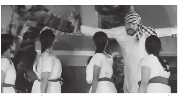
സംസ്ഥാന സ്കൂൾ കലോത്സവത്തിലെ സ്വാഗതഗാന ദൃശ്യാവിഷ്കാരത്തിലെ വിവാദമായ ഭാഗം