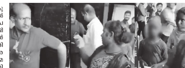
'നരികുറുവ' വിഭാഗത്തിലെ ആളുകളെ തിയേറ്ററിനുള്ളിലേക്ക് പ്രവേശിപ്പിക്കാൻ തടയുന്ന തിയേറ്റർ ജീവനക്കാർ

അഭിപ്രായപ്പെട്ടിരുന്നു. ഇതോടെ റോഹിണി സിനിമ സിനിമ മാന്ദിര്യമേറ്റ് വിശദീകരണ കുറിപ്പിറക്കി. ചിത്രത്തിനു യു/എ സർട്ടിഫിക്കറ്റാണെന്നും 12 വയസിന് താഴെയുള്ള കുട്ടികൾക്ക് ഇതു കാണാൻ അനുവദിക്കില്ലാത്തതുകൊണ്ടാണ് പ്രവേശനം നിഷേധിച്ചതെന്ന് തിയേറ്റർ ഉടമ വിശദീകരിച്ചു. മറ്റ് നിയമപ്രശ്നങ്ങൾ ഒഴിവാക്കി കുടുംബത്തെ സിനിമ