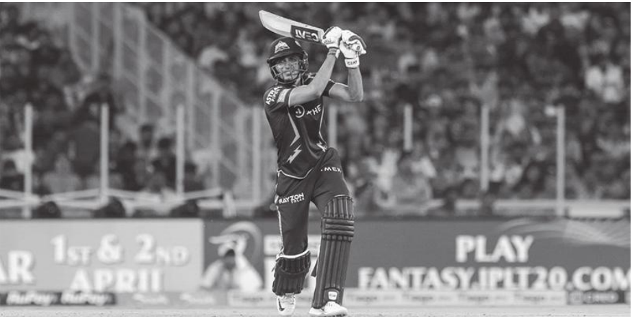
കഴിഞ്ഞ ദിവസം നടന്ന മത്സരത്തിൽ ഗുജറാത്ത് ടൈറ്റൻസ് താരം ശുഭാമർ ഗില്ലിന്റെയും സി.എസ്.കെ താരം ഋതുരാജ് ഗെയ്ക്വാദിന്റെയും ബാറ്റിങ്ങ്

സിലിടെ ചെന്നൈ സ്ട്രൈക്കർ മൂവോട്ടു ചലിപ്പിച്ചു. 50 പന്തിൽ 92 റൺസെടുത്ത ഗെയ്ക്വാദിനെ അൽസാരി ജോസഫ് ശുഭാമർ ഗില്ലിന്റെ കൈകളിലെത്തിക്കുമ്പോൾ ചെന്നൈ സേഫ് സോണിൽ എത്തിയിരുന്നു. ഒമ്പത് സിക്സും നാല് ഫോറും ഗെയ്ക്വാദിന്റെ ഇന്നിങ്സിന് മിഴിവേകി. 23 റൺസുമായി മോയിൻ അലിയും 19 റൺസുമായി ശിവം ഡുബെയും പുറകുതൊഴുതി 14 റൺസുമായി ക്യാപ്റ്റൻ എം.എസ് ധോണിയും ചെന്നൈ സ്ട്രൈക്കർമാർഡിൽ സാജാനുകൾ നൽകി. ഗുജറാത്തിന് വേണ്ടി മുഹമ്മദ് ഷമി, റാഷിദ് ഖാൻ, അൽസാരി ജോസഫ് എന്നിവർ രണ്ട് വിക്കറ്റുകൾ വീതവും ജോഷി ലിറ്റിൽ ഒരു വിക്കറ്റും നേടി. മുഹമ്മദ് ഷാറൂണിന്റെ ഗില്ലും വ്യൂഡിമാൻ സാഹയും ഗുജറാത്തിന് മികച്ച തുടക്കമാണ് നൽകിയത്. ഒന്നാം വിക്കറ്റിൽ ഇരുവരും 37൦൯൯