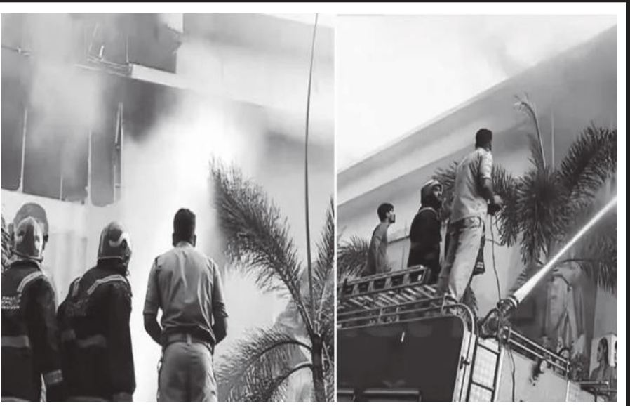
പുഷ്പ ജങ്ഷൻ സമീപത്തെ ആനിഹാർ റോഡിലെ ജയലക്ഷ്മി സിൽക്സിലുണ്ടായ തീപിടിത്തം നിയന്ത്രണ വിധേയമാക്കാൻ ശ്രമിക്കുന്ന അഗ്നിശമന സേന

ജൂൻ ഖാർഗെ പങ്കെടുത്ത വേദിയിൽ കെ.സുധാകരനും വി.ഡി സതീശനും രമേശ് ചെന്നിത്തലയും എം.എം.എസ്. മന്ത്രിമാണ് കെ.പി.സി.സി.യുടെ ഭാഗമായി സംസാരിച്ചത്. മുൻ കെ.പി.സി.സി. പ്രസിഡന്റ് എന്ന പരിഗണന തിരിച്ച് ലഭിച്ചില്ലെന്നും കെ.മുരളീധരന്റെ വൈക്കം സത്യഗ്രഹ വാർഷിക വേദിയിൽ എല്ലാ നേതാക്കൾക്കും പ്രസംഗിക്കാൻ അവസരം ലഭിക്കാതിരുന്നത് എന്താണ് കോട്ടയം ഡി.സി.സി.യുടെ വിശദീകരണം എന്നാൽ, പരിപാടിയിലെ സമയക്കുറവായിരുന്നു പ്രശ്നമെങ്കിൽ പത്ത് മിനിറ്റ് നേരത്തെ തുടങ്ങണമെന്നും സമയം ശരി തരൂർ പറഞ്ഞു.