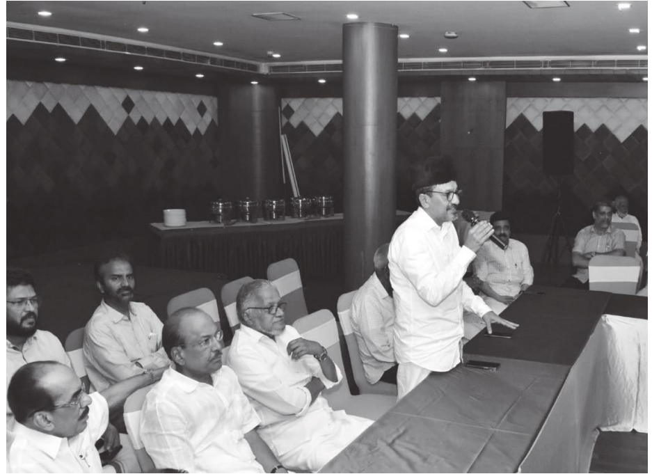
കെ.എൻ.എം സംസ്ഥാന സമിതി കോഴിക്കോട് സംഘടിപ്പിച്ച സൗഹൃദസംഗമം പാണക്കാട് സയ്യിദ് സാദിഖലി ശിഹാബ് തങ്ങൾ ഉദ്ഘാടനം ചെയ്യുന്നു