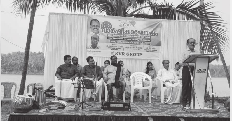
ഫ്രണ്ട്സ് ഓഫ് യോഗ കോഴിക്കോട് ചാപ്റ്ററിന്റെ 15ാം വാർഷിക പരിപാടിയിൽ നിന്ന്

ഫ്രണ്ട്സ് ഓഫ് യോഗ അടച്ചിട്ട് മുറിയിൽ യോഗ ചെയ്യാറില്ല. അത് ശരീരത്തിന് ഉത്തമമല്ല. നമ്മുടെ മാനസികവും, ശാരീരികവുമായ ഉത്തേജനത്തിന് വേണ്ടിയുള്ളതാണ് യോഗ. മഴക്കാലത്ത് മാത്രമാണ് വൃകളിൽ യോഗ ചെയ്യാനുള്ളത്. അപ്പോഴും വെന്റിലേഷൻ ഉറപ്പാക്കാനുണ്ട്.