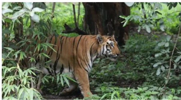
റുന്നു. എന്നാൽ വനപാലകർ സ്ഥലത്ത് എത്തി പരിശോധന നടത്തിയെങ്കിലും കടുവയെ കണ്ടെത്താനായില്ല. ഇടുക്കി വെട്ടിക്കാമറ്റം കവലയിലെ റോഡരികിലും കൃഷിയിടങ്ങളിലും വന്യജീവിയുടെ കാൽപ്പാടുകൾ നടത്തിയെങ്കിലും കടുവയെ കണ്ടെത്താനായില്ല. ഇടുക്കി വെട്ടിക്കാമറ്റം കവലയിലെ റോ

ഇടുക്കി: ഇരട്ടയാറിൽ വീണ്ടും കടുവയെ കണ്ടതായി നാട്ടുകാർ. കഴിഞ്ഞ രാത്രിയിൽ ജോലി കഴിഞ്ഞ് വീട്ടിലേക്ക് മടങ്ങിയ ആളാണ് വഴിയരികിൽ കടുവ നിൽക്കുന്നത് കണ്ടത്. കഴിഞ്ഞ ഒരാഴ്ചയായി കടുവ ഭീതിയിലാണ് ഇരട്ടയാർ പഞ്ചായത്തിലെ ഇടത്തേമല, അടയാളക്കല്ലി മേഖല. അതേസമയം വാങ്ങിയെടുത്തിട്ടുള്ള വീടുകളിൽ വെട്ടേറിപ്പോയ വനം വകുപ്പ് അറിയിച്ചു. ഇവിടെ കടുവയെ കണ്ടതാണ് അധികൃതർ പാഞ്ഞു. ഇതിനിടെ തിങ്കളാഴ്ച പുലർച്ചെ ഉദയഗിരി ടവർ ജങ്ഷനിൽ വൈക്കം യാത്രികർ രണ്ട് കടുവകളെ കണ്ടു