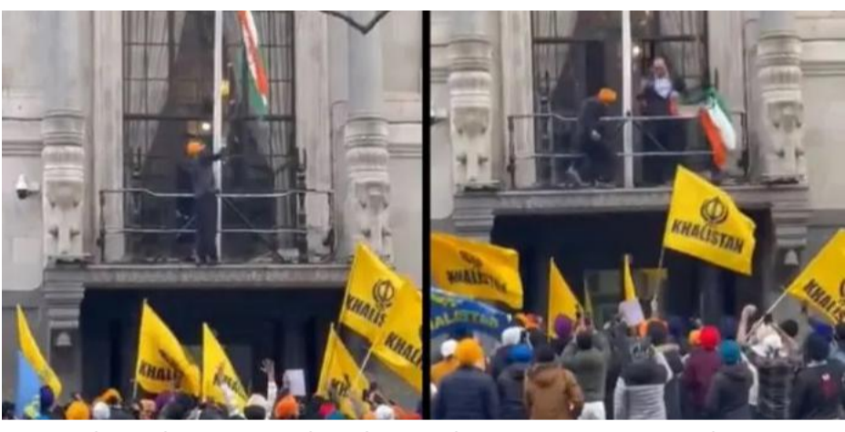
ലണ്ടനിൽ ഇന്ത്യൻ ഹൈക്കമ്മീഷന്റെ ബാൽക്കണിയിൽ വലിഞ്ഞു കയറിയ ചലിനപ്പാലം പ്രതിഷേധക്കാരിൽ ഒരാൾ ദേശീയ പതാക താഴെയിക്കാൻ ശ്രമം നടത്തിയപ്പോൾ