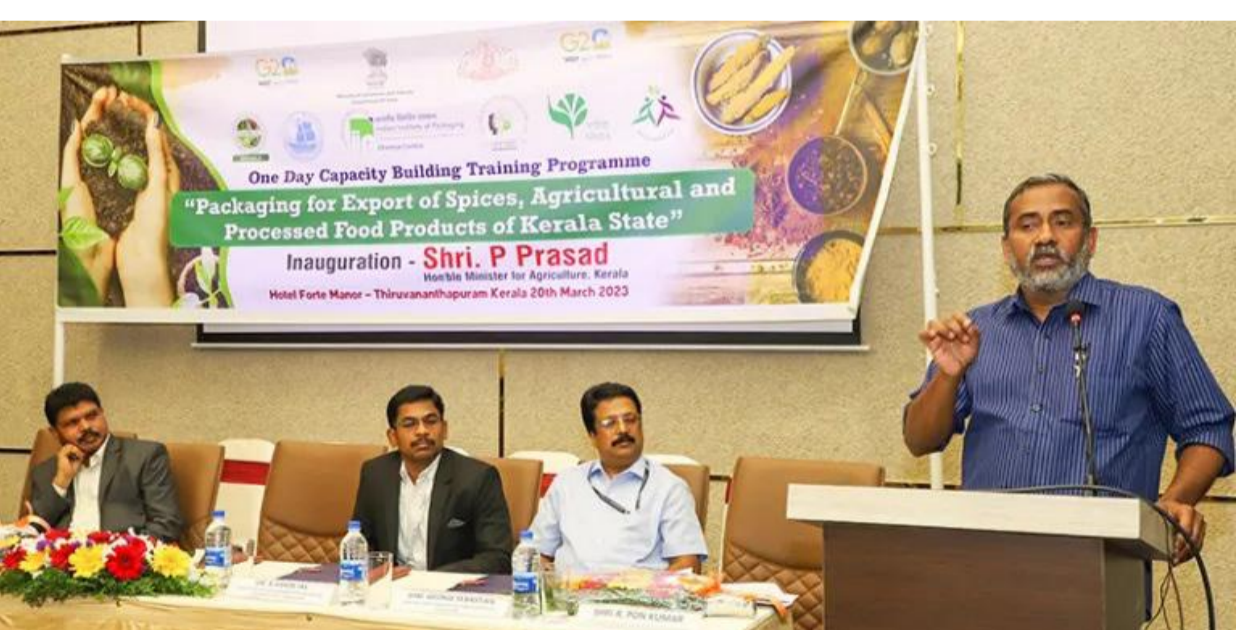
സുഗന്ധവ്യഞ്ജനങ്ങളുടെയും കർഷക മുല്ലവർമന ഉൽപ്പന്നങ്ങളുടെയും കയറ്റുമതിക്ക് വേണ്ടിയുള്ള പാക്കേജിങ്ങ് ഏകദിന പരിശീലന പരിപാടി തിരുവനന്തപുരത്ത് ഉദ്ഘാടനം ചെയ്ത് സംസാരിക്കുന്ന കൃഷിമന്ത്രി പി.പ്രസാദ്

തിരുവനന്തപുരം: മുല്ലവർ മനവിലയുടെ കർഷകരുടെ ഉൽപ്പന്നങ്ങൾക്ക് മികച്ച വില ലഭിക്കുമെന്നും അതിലൂടെ കർഷകരുടെ വരുമാനം വർദ്ധിപ്പിക്കുവാൻ കഴിയുമെന്നും കൃഷിമന്ത്രി പി. പ്രസാദ്. കർഷകരുടെ ഉൽപ്പന്നങ്ങൾ മുല്ലവർമനവ് നടത്തി വിപണനം നടത്തുന്ന വഴി അവരുടെ ജീവിത നിലവാരം ഉയർത്താനും സാധ്യമായ നേട്ടങ്ങൾ സമയബന്ധിതമായി പൂർത്തിയാക്കുമെന്ന് മന്ത്രി പറഞ്ഞു. സുഗന്ധവ്യഞ്ജനങ്ങളുടെയും കർഷക മുല്ലവർമന ഉൽപ്പന്നങ്ങളുടെയും കയറ്റുമതിക്ക് വേണ്ടിയുള്ള പാക്കേജിങ്ങ് എന്ന ഏകദിന പരിശീലന പരിപാടി തിരുവനന്തപുരത്ത് ഉദ്ഘാടനം ചെയ്ത് സംസാരിക്കുകയായിരുന്നു മന്ത്രി. 11 വകുപ്പുകളെ സംയോജിപ്പിച്ചുകൊണ്ട് മുല്ലവർമന മേഖലയിൽ സർക്കാർ ഇടപെടലുകൾ നടത്തുന്നതിനായി വാഹ്യൂഴ അഡ്വൈസറിയുടെ കർഷകരുടെ പങ്കാളിത്തമുള്ള കേരള അഗ്രി ബിസിനസ് കമ്പനിയുടെ പ്രവർത്തനങ്ങൾ ഉടൻ ആരംഭിക്കും. ഒരു കൃഷിമന്ത്രിയുടെ മുല്ലവർമന ഉൽപ്പന്നങ്ങൾക്ക് മികച്ച വില ലഭ്യമാക്കുന്നതിന് വേണ്ടിയുള്ള പാക്കേജിങ്ങ് എന്ന തരത്തിൽ കേരളത്തിലെ കർഷകരുടെയും കൃഷിയുടേയും ഉൽപ്പന്നങ്ങളെ ഉയർത്തിയുയർത്തുന്നതിന് വിപണനത്തിൽ ഉൾപ്പെടുത്തുന്നതിന് സാധ്യമായ നേട്ടങ്ങൾ സമയബന്ധിതമായി പൂർത്തിയാക്കുമെന്ന് മന്ത്രി പറഞ്ഞു. സുഗന്ധവ്യഞ്ജനങ്ങളുടെയും കർഷക മുല്ലവർമന ഉൽപ്പന്നങ്ങളുടെയും കയറ്റുമതിക്ക് വേണ്ടിയുള്ള പാക്കേജിങ്ങ് എന്ന ഏകദിന പരിശീലന പരിപാടി തിരുവനന്തപുരത്ത് ഉദ്ഘാടനം ചെയ്ത് സംസാരിക്കുകയായിരുന്നു മന്ത്രി.