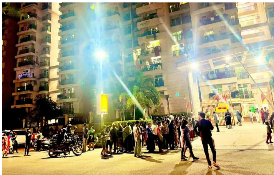
ഡൽഹിയിൽ മൂന്ന് സെക്കന്റോളം നീണ്ടുനിന്ന ചുവടുകൾ തുടർന്ന് ചുറ്റും കളിച്ച് നിന്ന് പുറത്തേക്കിറങ്ങി നിൽക്കുന്ന ജനങ്ങൾ

ന്യൂഡൽഹി: ഇന്ത്യയെപ്പോലെയുള്ള മറ്റ് രാജ്യങ്ങളിൽ ഉൾപ്പെടെ ആറ് രാജ്യങ്ങളിൽ ഭൂകമ്പത്തിന്റെ ആഘാതമുണ്ടായി. ഭൂകമ്പത്തോടനുബന്ധിച്ച് ഡൽഹി, ജമ്മുകശ്മീർ തുടങ്ങി ഇന്ത്യയിലെ വിവിധ സംസ്ഥാനങ്ങളിൽ ഭൂചലനം റിപ്പോർട്ട് ചെയ്തു.