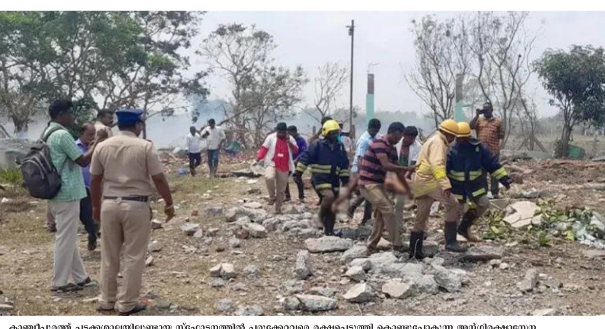
കാബൂലിപുരത്ത് പടക്കശാലയിലുണ്ടായ സ്ഫോടനത്തിൽ പരുക്കേറ്റവരെ രക്ഷപ്പെടുത്തി കൊണ്ടുപോകുന്ന അഗ്നികക്ഷാസേന