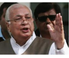
കാത്തിരിക്കുന്നത്. ഇവയിൽ രണ്ട് ബില്ലിലാണ് ഗവർണ്ണർ കഴിഞ്ഞ ദിവസം ഒപ്പുവെച്ചത്. തലങ്കര സർക്കാർ ഗവർണ്ണർക്കെതിരെ സുപ്രീംകോടതിയെ സമീപിച്ചതുപോലെ കേരളം സമീപിച്ചാലോ എന്ന മാധ്യമപ്രവർത്തകരുടെ ചോദ്യത്തോട് അത് ഓരോരുത്തരുടെയും അവകാശമാണെന്നാണ് ഗവർണ്ണർ മറുപടി നൽകിയത്.

ന്യൂഡൽഹി: സർവകലാശാല ദേശഗതി ബിൽ ഉൾപ്പെടെ ഇനി ഒപ്പിടാനുള്ള ബില്ലുകളിൽ ഉടൻ തീരുമാനമെടുക്കുമെന്ന് ഗവർണ്ണർ ആരിഫ് മുഹമ്മദ് ഖാൻ. ഭരണഘടനാപരമായ കർത്തവ്യം നിർവഹിക്കലാണ് അദ്ദേഹത്തിന് ഉദ്ദേശ്യമെന്നും ആരിഫ് മുഹമ്മദ് ഖാൻ ഡൽഹിയിൽ പറഞ്ഞു. വഖാഫ് ബില്ലിലും മലപ്പുറം ജില്ലാ സഹകരണ ബാങ്കിനെ കേരള ബാങ്കിൽ ലയിപ്പിക്കാനുള്ള ബില്ലിലും മാണ് ഗവർണ്ണർ ഒപ്പിട്ടത്. എന്നാൽ, വിവാദ ബില്ലുകളിൽ ആരിഫ് മുഹമ്മദ് ഖാൻ ഇതുവരെ ഒപ്പുവെച്ചിട്ടില്ല. ചാൻസലർ ബില്ലും ലോകായുക്താ ബില്ലുമടക്കം സംസ്ഥാന നിയമസഭ പാസാക്കിയ എട്ട് ബില്ലുകളിലാണ് അനുമതി