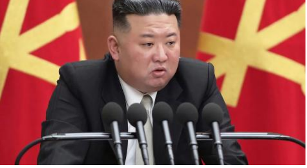
ഉത്തര കൊറിയയിലെ പഴയ നിയമം. എന്നാലിപ്പോൾ കുട്ടികൾ ഹോളിവുഡ് ചലച്ചിത്രങ്ങളോ സീരിയലുകളോ കാണാൻ മാതാപിതാക്കളെ തടവിലിടുന്ന കർശന നിലപാടിലാണ് ഉത്തര കൊറിയ.

സിയാൾ: കുട്ടികൾ വിദേശ സിനിമകളെ സിനിമകളോടൊപ്പം കാണാൻ കഴിയാതെ കഴിയാതെ സിനിമകൾക്ക് ഗുരുതരമായ മുന്നറിയിപ്പ് നൽകുക എന്നതായിരുന്നു ഉത്തര കൊറിയയിലെ പഴയ നിയമം. എന്നാലിപ്പോൾ കുട്ടികൾ ഹോളിവുഡ് ചലച്ചിത്രങ്ങളോ സീരിയലുകളോ കാണാൻ മാതാപിതാക്കളെ തടവിലിടുന്ന കർശന നിലപാടിലാണ് ഉത്തര കൊറിയ. റോഡിയോ ഫ്രീ ഏഷ്യയാണ് ഈ കാര്യം റിപ്പോർട്ട് ചെയ്യുന്നത്. കെ-ഡ്രാമ എന്ന് അറിയപ്പെടുന്ന ദക്ഷിണകൊറിയൻ സിനിമകളും സീരിയലുകളും കാണുന്നതിന് വിദേശം ചെന്നുവന്നാൽ ഉത്തര കൊറിയയിൽ കർശനമായി നിരോധിച്ചിട്ടുണ്ട്. സോഷ്യലിസ്റ്റ് ആശയങ്ങൾ കൂട്ടിക്കൊടുത്ത് 'ശരിയായി' പഠിപ്പിക്കാനാണ് മാതാപിതാക്കൾ