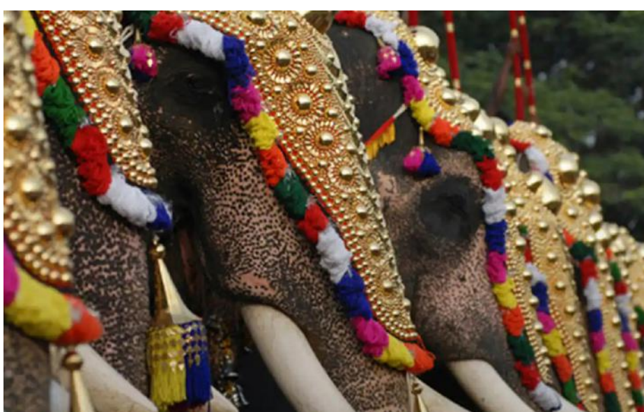
നട്ടിട്ടുള്ള ആവശ്യത്തിന് അനുകൂലമായ തീരുമാനം സ്വീകരിക്കാനുള്ള സമയം ഹിന്ദു റിപ്പബ്ലിക്ക് എൻഡോവ്മെന്റ് സ് വകുപ്പ്

ചെന്നൈ: തമിഴ്നാട്ടിൽ ഇനി സ്വകാര്യ വ്യക്തികളോ മതസ്ഥാപനങ്ങളോ ആനകളെ സ്വന്തമാക്കാനോ പരിപാലിക്കാനോ പാടില്ലെന്ന് മദ്രാസ് ഹൈക്കോടതി ഉത്തരവു പുറപ്പെടുവിച്ചു. വ്യക്തികളോ മതസ്ഥാപനങ്ങളോ ആനകളെ കൈവശം സൂക്ഷിക്കുന്നില്ലെന്ന കാര്യം ഉറപ്പുവരുത്താൻ പരിസഥിതി, വനവകുപ്പ് സെക്രട്ടറിക്ക് ഹൈക്കോടതിയുടെ മധുര ബെഞ്ച് നിർദ്ദേശം നൽകി. സംസ്ഥാനത്തെ എല്ലാ ക്ഷേത്രങ്ങളുടേയും സ്വകാര്യവ്യക്തികളുടെ ഉടമസ്ഥയിലുള്ള ആനകളേയും ഉടനടി പരിശോധിക്കണമെന്നും നിർദ്ദേശിച്ചു. ക്ഷേത്രങ്ങളുടേയും സ്വകാര്യ വ്യക്തികളുടേയും കീഴിലുള്ള എല്ലാ ആനകളേയും സർക്കാരിന്റെ പറ്റുനിയോഗം കേന്ദ്രങ്ങളിലേക്ക് മാറ്റാനായി ഉയർ