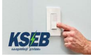
വൈദ്യുതി ഉപയോഗം വൈകുന്നേരം ആറുമുതൽ 11നും ഇടയിൽ പരമാവധി കുറയ്ക്കണം: കെ.എസ്.ഇ.ബി

തിരുവനന്തപുരം: തുലാവർഷത്തിൽ വേണ്ടത്ര മഴ ലഭിക്കാതെത്തുടർന്ന് വേനൽ കടുത്തതും കാരണം ഇടയ്ക്കി അണക്കെട്ടിലെ ജലനിരപ്പ് ക്രമാതീതമായി കുറഞ്ഞിരിക്കുകയാണ്. കഴിഞ്ഞ ആറു വർഷത്തെ ഏറ്റവും കുറവ് ജലനിരപ്പാണ് കെ.എസ്.ഇ.ബിയുടെ ജലസംഭരണകെട്ടിൽ നിലവിലുള്ളത്. പീക്ക് സമയത്തെ വൈദ്യുതി ഉപയോഗമാകട്ടെ കൂട്ടിച്ചേർക്കുകയാണ്. വൈദ്യുതി ഉപയോഗം ഇത്തരത്തിൽ ക്രമാതീതമായി ഉയരുകയും ആദ്യനര ഉൽപ്പാദന സാധ്യത കുറയുകയും ചെയ്താൽ പ്രതിസന്ധി രൂക്ഷമാകും. അതിനാൽ ഉപഭോക്താക്കൾ വൈകുന്നേരം ആറു മുതൽ 11 വരെ ഉയർന്ന വൈദ്യുതി ഉപഭോഗമുള്ള ഉപകരണങ്ങൾ ഉപയോഗിക്കുന്നത് ഒഴിവാക്കണമെന്നാണ് കെ.എസ്.ഇ.ബി നിർദ്ദേശം. ഇസ്മിതിലൂടെ, വാട്ടർ പമ്പ് സെറ്റ്, വാഷിംഗ് മെഷീൻ, ഇൻ