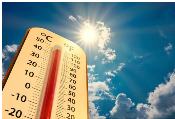
വരും ദിവസങ്ങളിൽ ഇതിനേക്കാൾ ശക്തമായി താപനില വർദ്ധിക്കും. മാർച്ച്-മെയ് മാസങ്ങളിൽ താപനില ഉയരും.

ന്യൂഡൽഹി: 123 വർഷത്തിനുള്ളിൽ രേഖപ്പെടുത്തിയ ഏറ്റവും ഉയർന്ന ചൂട് ഫെബ്രുവരിയിലെന്ന് കേന്ദ്ര കാലാവസ്ഥാ നിരീക്ഷണ കേന്ദ്രം അറിയിച്ചിട്ടുണ്ട്. 29.5 ഡിഗ്രി സെൽഷ്യസ് ആണ് രേഖപ്പെടുത്തിയിട്ടുള്ള താപനില. ഡൽഹി ഉൾപ്പെടെ രാജ്യത്തിന്റെ വടക്ക്-കിഴക്ക് സംസ്ഥാനങ്ങളിൽ ഏറ്റവും ഉയർന്ന താപനിലയായിരിക്കും വരും ദിവസങ്ങളിൽ രേഖപ്പെടുത്തുകയെന്നും കാലാവസ്ഥാ വകുപ്പ് വ്യക്തമാക്കുന്നു. ഏറ്റവും ഉയർന്ന താപനിലയാണ് ഫെബ്രുവരിയിൽ രേഖപ്പെടുത്തിയത്.