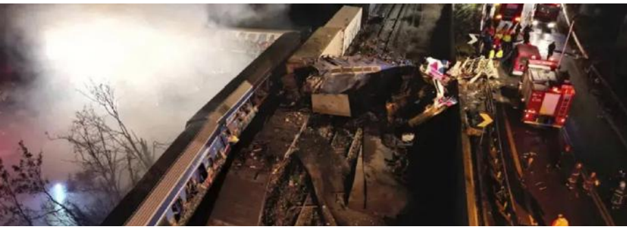
ഗ്രീസിൽ ഭൂതകമ്പനികൾ തമ്മിൽ കൂട്ടിയിടിച്ചുണ്ടായ അപകടത്തിൽ നിന്ന്