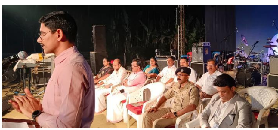
പൊന്നുത്തങ്കം സമാപന സമ്മേളനം ഉദ്ഘാടനം ചെയ്ത് സംസാരിക്കുന്ന കണ്ണൂർ റോബ് ഡി.എ.ജി പട്ട വിലാസിയ്യ

തലശ്ശേരി: വാൽക്കണയിലെ ചോരകോണ്ട് കണക്കുകൾ തീർത്ത ഗതകാല കടത്തനാടിന്റെ മണ്ണിൽ ഇതിഹാസം പേറാല ജീവിച്ചു. തെയ്യരൂപം പൂണ്ട് ആരാധനാമൂർത്തിയായി മാറിയ തച്ചോളി ദത്തനന്ദേയ്യം, പെറ്റ നാട്ടിലെ അങ്കത്തട്ടിൽ ശിഷ്യന്മാർ വധിക്കപ്പെട്ട കതിരൻ ഗുരിക്കുട്ടിയേയും മായാത്ത ഓർമകളിൽ നടന്ന സപ്തദിന പൊന്നുത്തങ്കത്തിന്റെ കളരിവളക്കണത്തും ഉറുമിയുടേയും വാർത്തലപ്പു കളുടേയും ശിൽക്കാരങ്ങളും, കളരി കരളിലേറ്റിയവരുടെ ആരവങ്ങളും പൊടുന്നനെ നിലച്ചപ്പോൾ ആത്മ നിർവൃതിയും പ്രതിക്ഷകളുമാണ് സംഘടകരുടെ മുഖത്ത് പ്രകടമായത്. പുറം കഴിഞ്ഞ പാവൻ പോലെ ഏഴരക്കണ്ടം മുക്തമാ