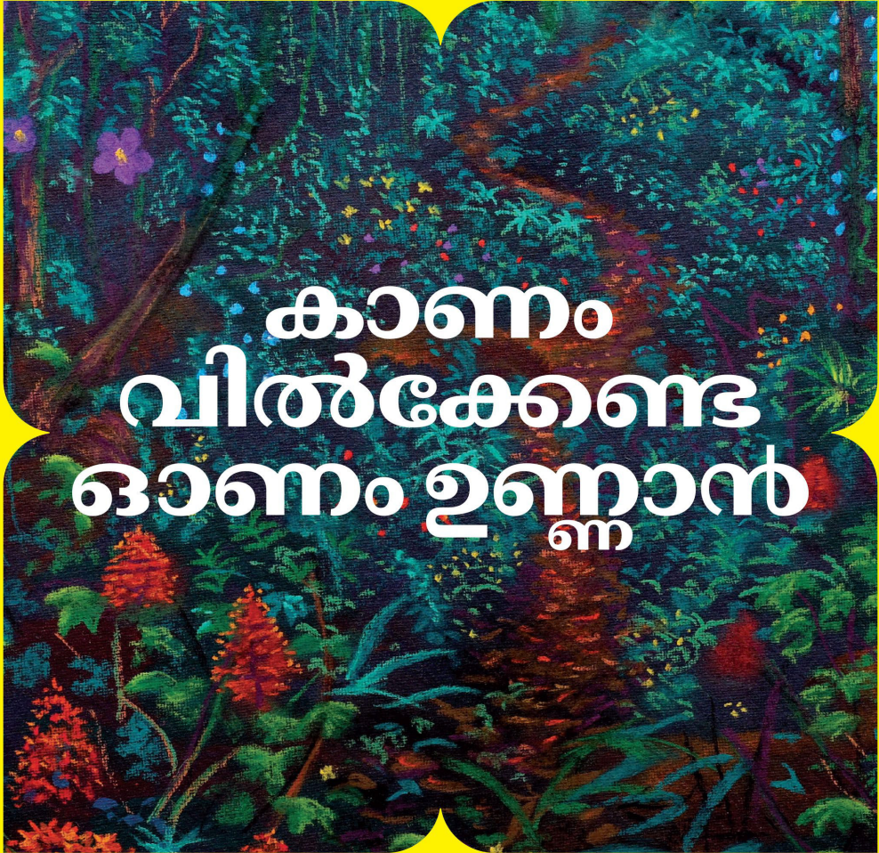
Painting, Aji Adoor